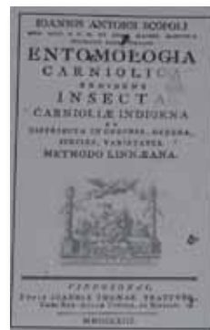
Naslovnici: Dissertatio de Apibus (1770) in Entomologia Carniolica (1763)

»Razne vrste bučel«, ki ga je leta 1873 objavil Slovenski gospodar. V njem je opisanih devet »plemen čebel«, med njimi posebej »kranjska bučela«.