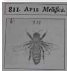
Izpis iz dela Dissertatio de Apibus in Scopolijeva risba (bakrorez) naše čebele.

od prvih pisem je Linne zapisal: »... Žuželke so moje veselje; če si mi jih pripravljen kaj poslati in bom med njimi našel nove, jih nikoli ne bom imenoval, ne da bi Te spoštljivo omenil ...«. Morda je prav v tem stavku ključ odgovora o izbiri imena.