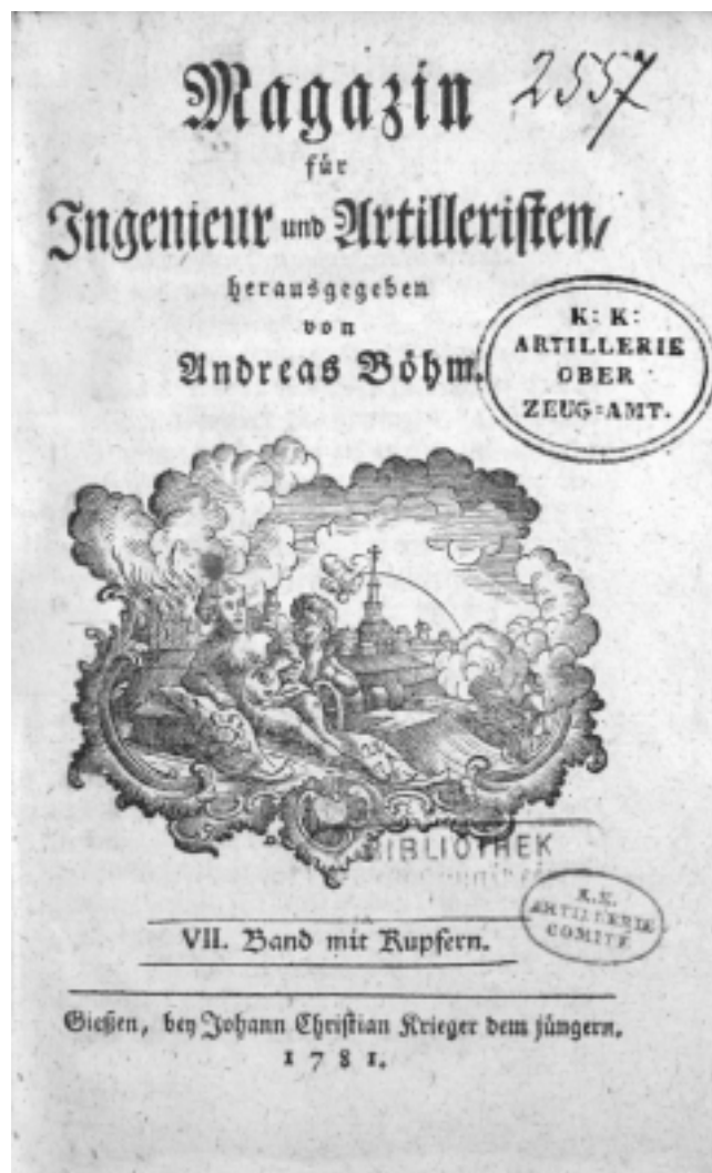
Slika 1: Naslovnica Böhmove topničarske revije, ki jo je s pridom študiral Vega (vir: Böhm, Andreas. 1781. Magazin für Ingenieur und Artilleristen . (Giessen: Johann Christian Krieger) 7: naslovnica)

Vega je navajal raziskave svojih predhodnikov, vendar je Robinsa vseskozi napak imenoval "Robin". 14 Poznal je Eulerjevo dopolnitev Robinsovega dela. Zanimal se je tudi za Mullerja, ki je postal namesto tekmeča Robinsa profesor topništva in utrdil na novi vojaški akademiji v Woolwichu blizu tovarne topov. Mullerjevo razpravo je za Böhmovo revijo prevedel eden njenih najmarljivejših piscev, Geuss. 15 Geuss je