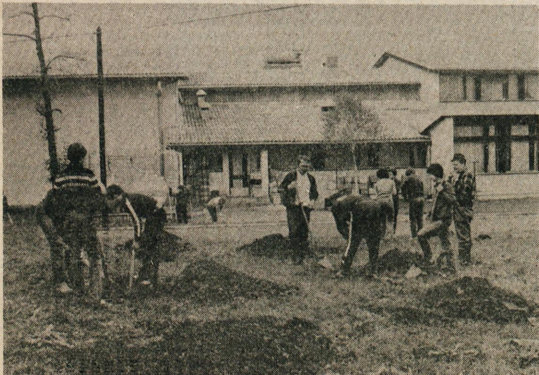
Pionirji radi delajo in so pripravljani delati. Za svoje delo pa so radi tudi pohvaljeni, kajti to jim daje novih moči in vzpodbud.