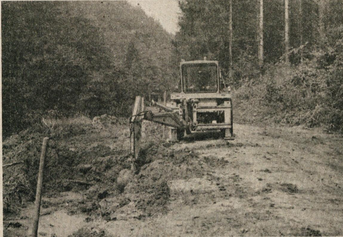
Gozdne ceste so dvakrat koristne. Poleg spravila lesa služijo tudi mnogim občanom v odročnih krajih za prihod oziroma odhod na delo, šolo, trgovino...

Opravljenega je torej že veliko dela, načrtov in dobre volje pa tudi ne manjka. Upajmo, da se ne bo zataknilo pri finančnih sredstvih?