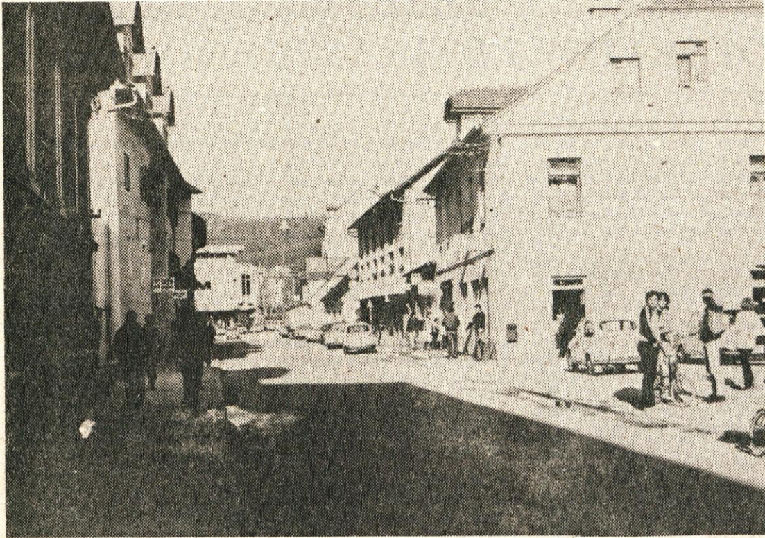
Tudi krajevna skupnost Litija — desni breg ima odslej prostore v središču mesta, na Valvazorjevem trgu, skupaj s Turističnim društvom.