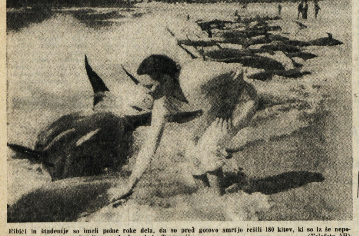
Ribiči in študentje so imeli polne roke dela, da so pred gotovo smrtjo rešili 180 kitov, ki so iz še nepojasnjenih vzrokov zaplavali na vzhodno obalo Tasmanije