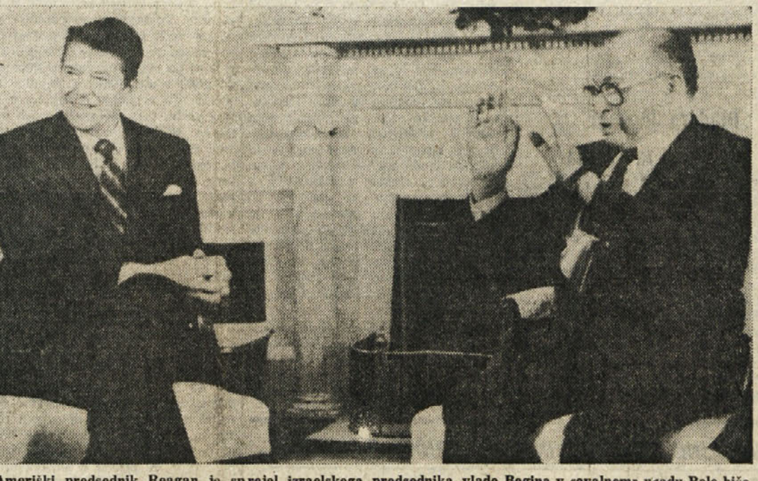
Ameriški predsednik Reagan je sprejel izraelskega predsednika vlade Begin v «ovalnem» uradu Bele hiše