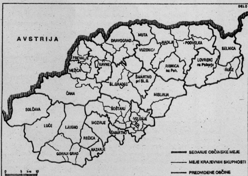
Shema novih občin na severu Slovenije, ki jo je 8. januarja objavil časnik DELO

Komisija je ob zaključku razprave sprejela sklep, da se v roku enega tedna sestanejo sveti KS (njihovi predsedniki so tudi člani komisije) in preverijo svoja načelna stališča v zvezi z bodočo reorganizacijo. Komisija se bo znova sestala v ponedeljek, 17. januarja, in razpravljala o stališčih svetov KS, do takrat pa naj bi občinski upravni organi pripravili tudi evidenco premoženja. Čimprej bo potrebno sklicati tudi zbere krajanov.