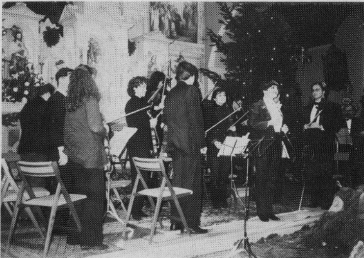
Komorni orkester PRO ARTE je požel bučne aplavze