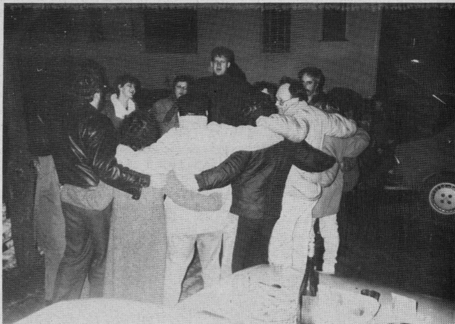
V Nazarjah so "cvetličarji" v "Kregarjevi ulici" takole povsem spontano proslavili prihod novega leta