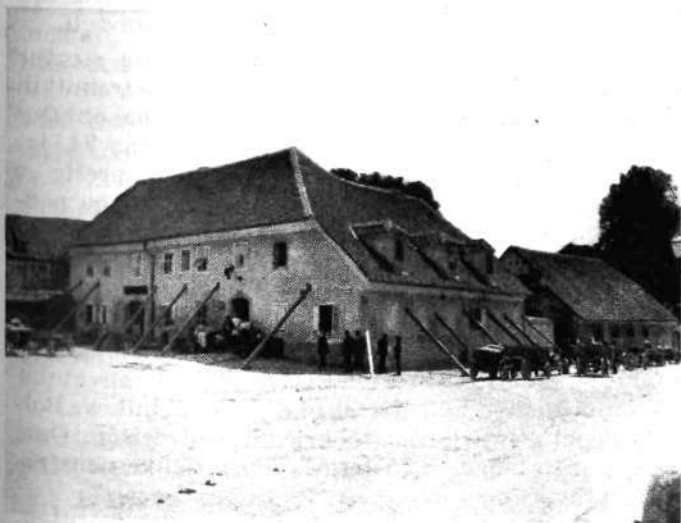
Križevniški — Valvasorjev trg z gostilno „Numero Eins“ l. 1895.

Mož gradi izključno na fizikalnih načelih (je študiral tudi potres v Zagrebu iz leta 1880.) ter trdi, da so ti potresi vulkanskega izvora. Na podlagi svojih izvajanj pride do zaključka, da v Ljubljani ne bo več potresa — Ljubljana »naj se za zmirom pomiri in