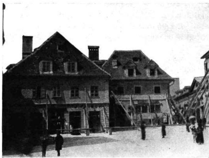
Vhod v Slonovo — (sedaj Prešernovo ulico) z Bernardovo trgovino s steklom