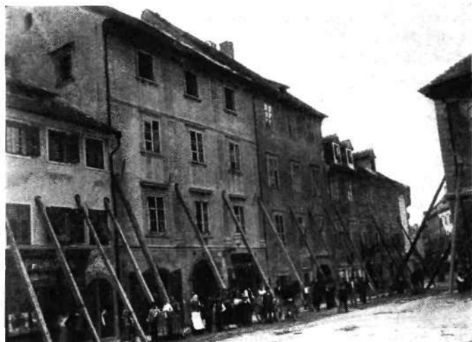
Sv. Jakoba trg 9 — Paluzove hiše