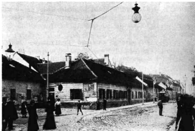
Prihod na Dunajsko cesto; vojaško skladišče, sedaj Aleksandrova cesta