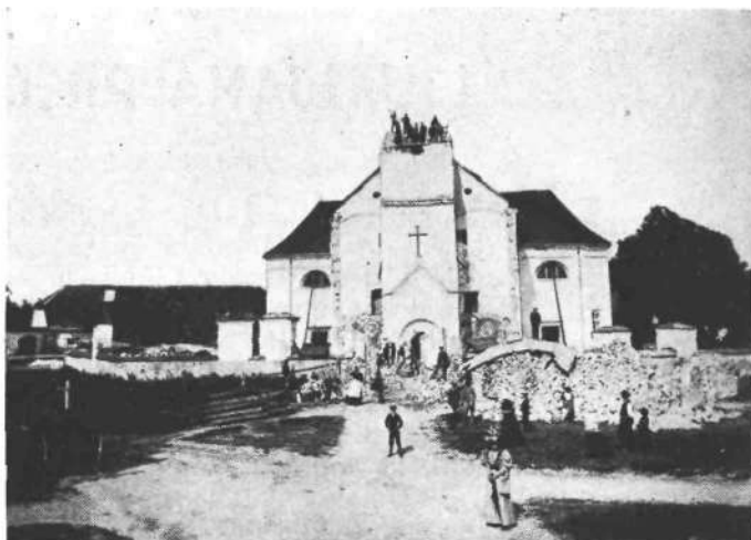
Romarska cerkev Božjega groba v Štepanj vasi

Deložirancem je dalo vojaško stacijsko poveljstvo takoj šotore na razpolago in obenem brzojavno prosilo od trupne komande še za 30 šotorov in jih je