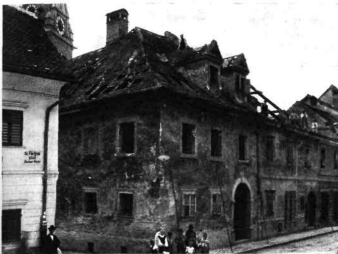
Staro šentjakobsko župnišče v Florijanski ulici