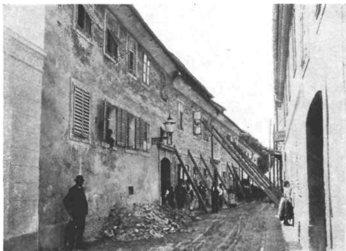
Gradlišče z mestno ubožnico

Prvi sunek je trajal 23 sekund in je bil najhujši. (I. R. navaja za prvi glavni sunek 6—7 sek.)