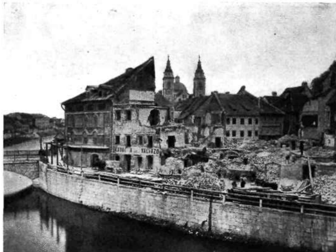
Francovo, sedaj Cankarjevo nabrežje, Sossova in Schreyerjeva hiša

sedno streho. Tam se je udril strop in pokopal ubogo šiviljo.