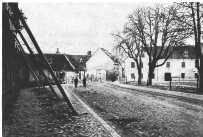
Gradlišče 14 in Mišerjeva ulica, sedaj uradniška hiša

Tresljaji so se ponavljali na velikonočni ponedeljek 15. aprila tja do četrte ure popoldne brez nahanja. Našteli so vsega 47 sunkov. 20. aprila je bil močan sunek, 22. aprila več manjših, 30. aprila prav