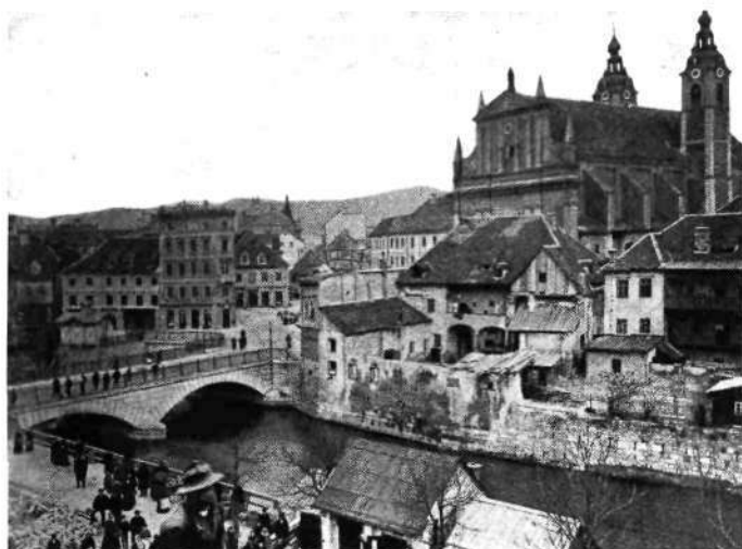
Obrežje ob frančiškanskem mostu — Sv. Petra cesta