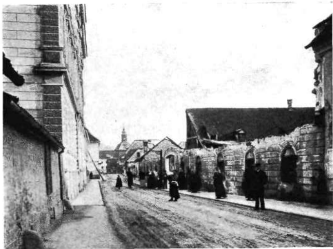
Rimska cesta 5, z gostilno „Pri nemškem vitezu“ l. 1895.