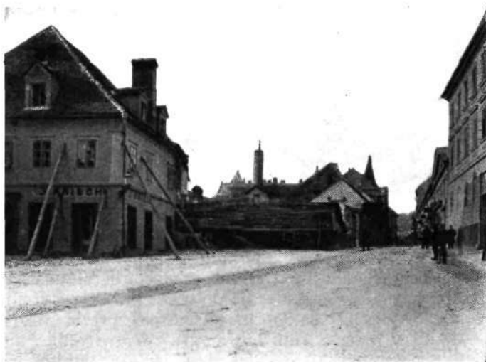
Marijin trg, vhod v Slonovo, sedaj Prešernovo ulico