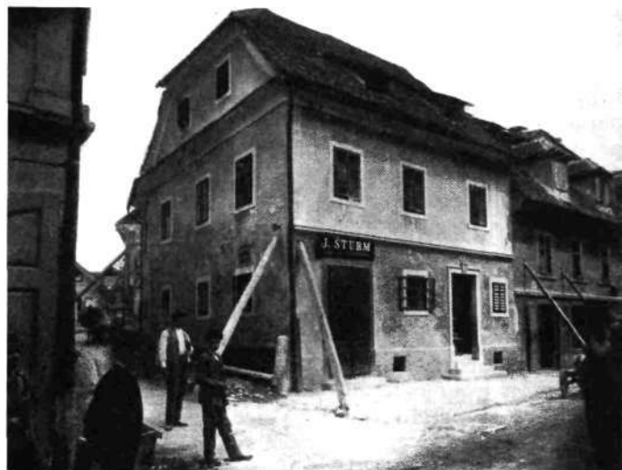
Vhod v Kolodvorsko ulico iz Šentpeterske ceste. Desna stran je zaradi razširjenja podrtá