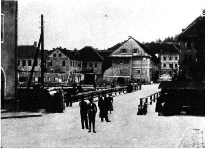
Mesarski most v Kopitarjevi ulici z gostilno „Pri Škerjancu“

Ljudje so se s pobožnostjo udeleževali maš. 12. maja je bila procesija, katere se je udeležilo gotovo deset tisoč ljudi. Mnogi so se prostovoljno postili.