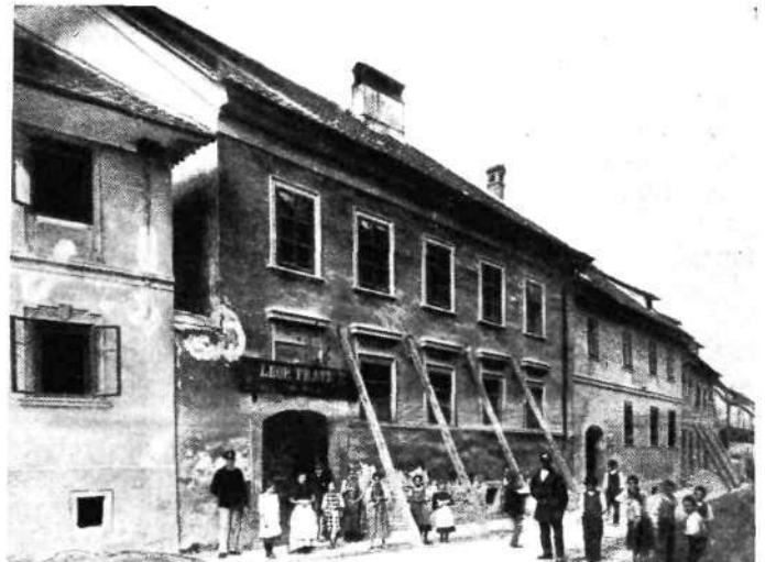
Šentpeterska cesta št. 27