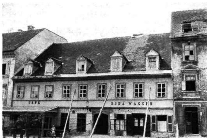
Kongresni trg, kavarna Fischer s Fischerjevo hišo

— dež. predsednik je spal tu nekaj dni. V tovornih vozovih so preprosti ljudje — 10 na 1 voz. Vsak stanovalec ima številko voza registrirano v žel. uradu. Pred osebne vozove postavijo ponoči lokomotivo za gretje.