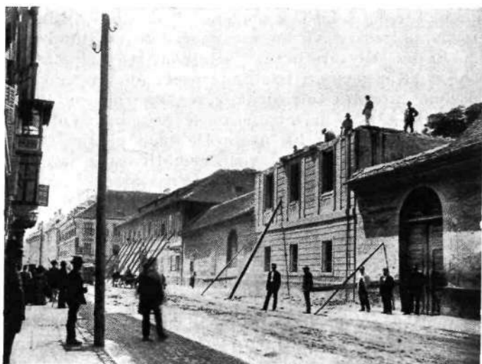
Dunajska cesta št. 1, vojaško oskrbovališče. Sedaj stoji na tem mestu palača Kreditne banke