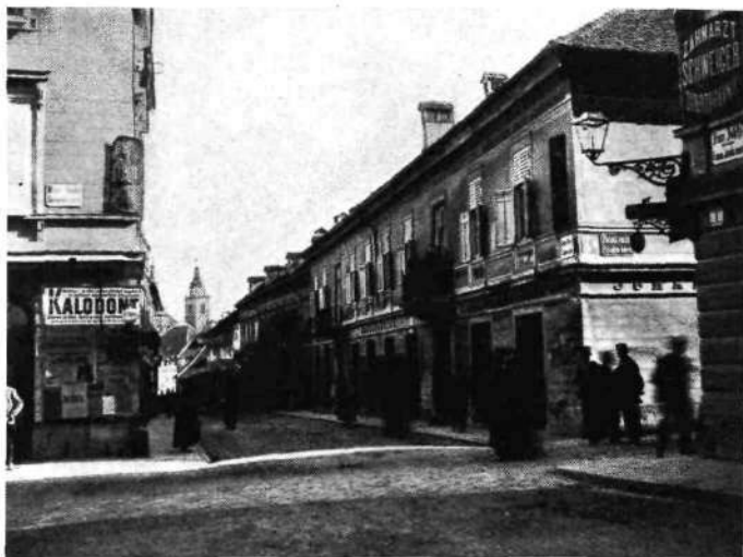
Lukmanova hiša na vogalu Slonove, sedaj Prešernove ulice

Stolpi so se majali, ure so se ustavile. Ura v zvoniku cerkve sv. Jakoba je še nekaj časa po potresu kazala na \frac{1}{2} 12. uro. Zvonovi so zvonili (cerkev sv. Petra i. dr.) kakor Ljubljani za pogreb. Trdni grad je pokal, ljudje so se tresli groze, da se bo sesul. Trstenjak navaja epizodo iz prvega časa potresa: v gradu nedaleč od Litije so imeli takrat umirajočega v hiši. Ko se je začel ples po sobi, je umirajoči preklinjal in molil, izpod zemlje se je slišalo bučanje. Vsi prisotni so verovali, da je sam hudič prišel ponj.