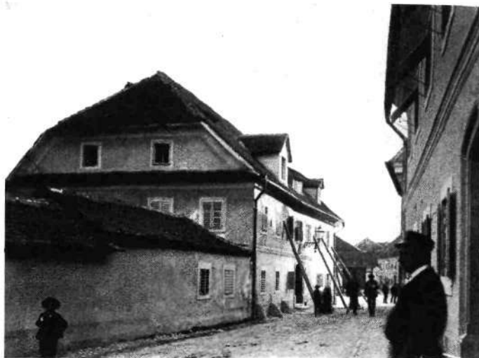
Vegova ulica 9, vhod na Križevniški trg z gostilno „Pri Šikcu“

brezpogojno zida naprej.« Seidl pa prišteva naše potrese med tektonske (isto I. R.) ali dislokacijske, ki nastanejo radi pogrezanja in premikanja kamenih ogrodij, grud, zato jih imenuje tudi grudovne.