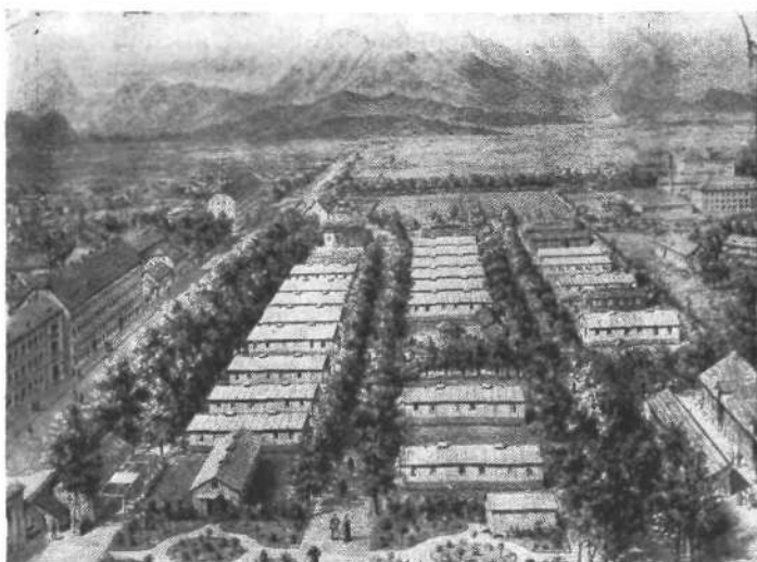
Deželna bolnica po potresu 1895