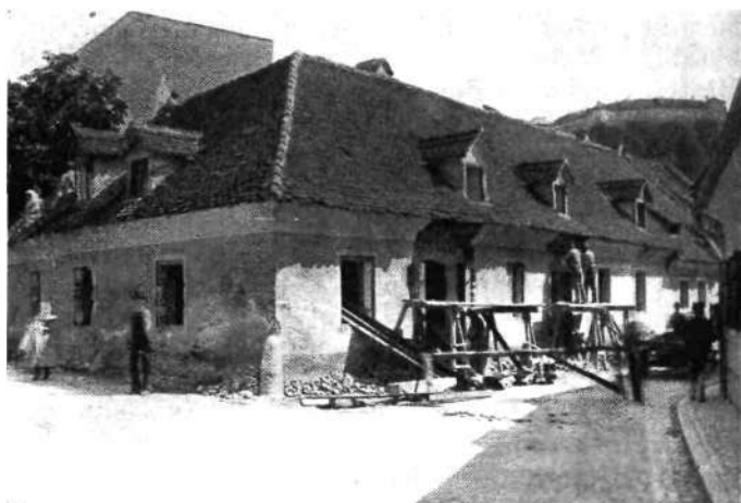
Kolodvorska ulica, vogal „Zrna“