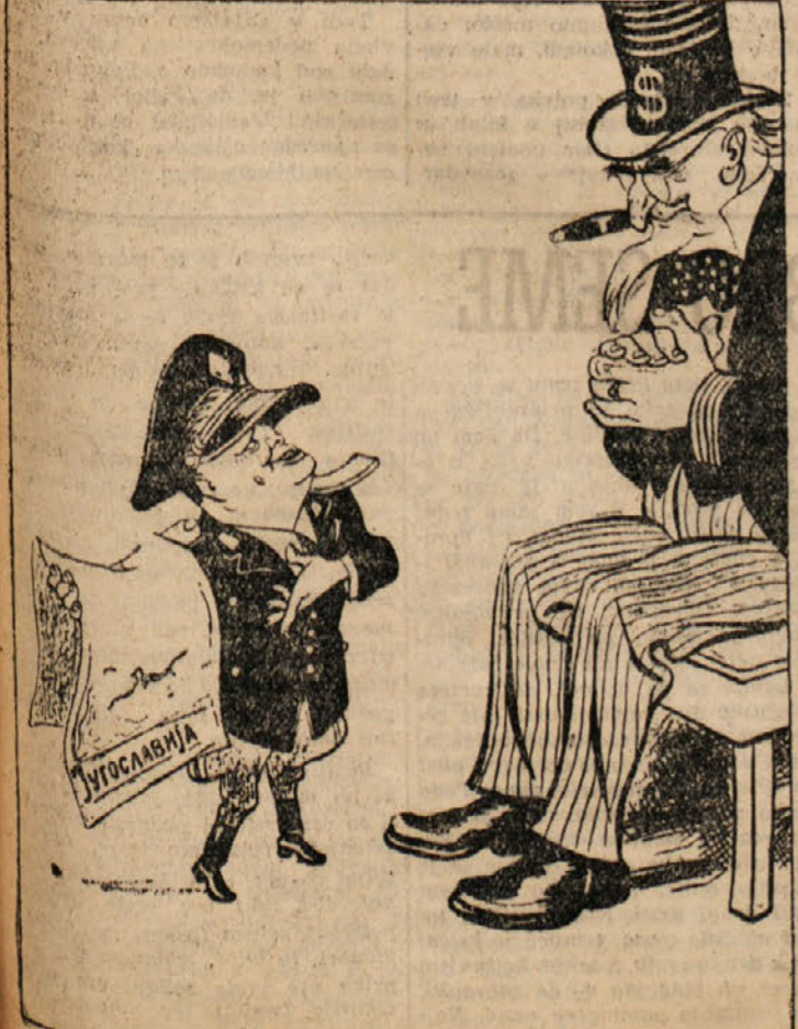
TITO (prodaja Jugoslavijo): Prodajam na debelo in na drobno. Kar ven z dolarji.

... mi imamo tako lepe stvari na prodaj, za katere lahko obimo vse kar hočemo (besede iz Titovega zaključnega govora na III Kongresu ljudske fronte)