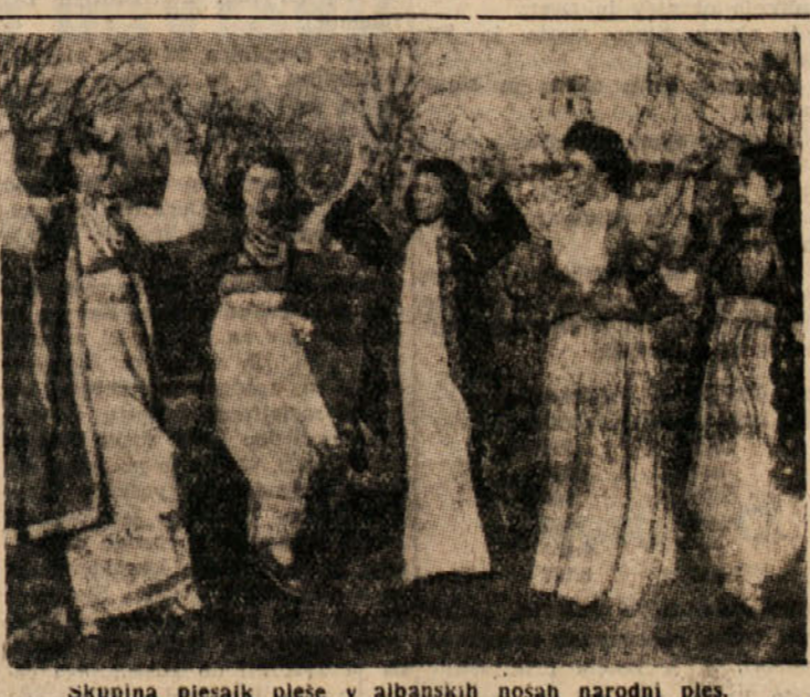
Skupina piesaik pleše v albanskih nosah narodni pies.

S temi svojimi krilatimi dokuzujejo svoj histerični šovinizem. Vsak drugi komunist ali demokrat