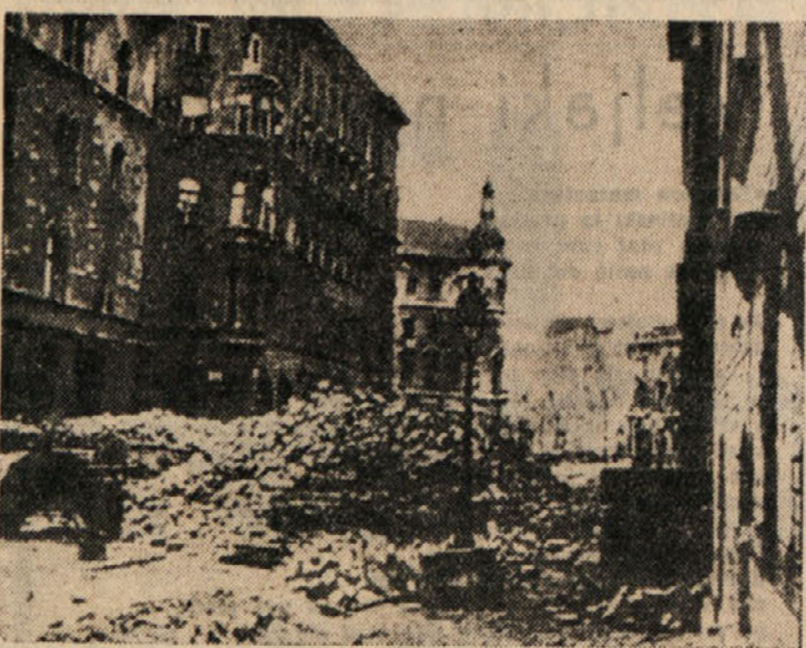
Nemci in madžarski fašisti so branili Budimpešto 2 meseca pred Rdečo armado. Tekom obkoljevanja je ostalo nepoškodovanih le 10.323 poslopj od 39.643 nepoškodovane so bile smatrane tiste hiše, kjer je bila poškodovana edino streha, okna in notranja oprema, ker so skoraj v vseh hišah bile razbite šipe.

Slovenske žene lahko volijo samo stranko, ki jo preganjajo vsi današnji gospodarji v Trstu in v Jugoslaviji, ker se bori proti bedi in zatiranju, ki jih mogoče nalagajo na našo ženo, na našo mater, na naše družine. Ta stranka je v Trstu Komunistična partija, a v okoljskih okrajih je Slovensko-Italijanska antifašistična unija, ki združuje demokrate v eno fronto proti vsem izkoriščevalcem.