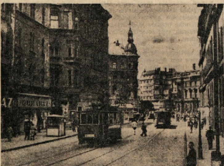
Danes sta objavljeni že več kot dve tretjini Budimpešte. Tako je skrbela madžarska vlada za dvig življenjske ravni delovnega ljudstva. Nasprotno pa mora ugotavljati Tito, eda spijo markske delavci na slama brez najosnovnejših življenjskih potrebščin. Tudi v Trstu ni bilo skoraj nobene obnove ali pa je bila v korist kapitalistov. Na to naj pomislil vsak volivec, ko bo stal pred volivno skrinjico.