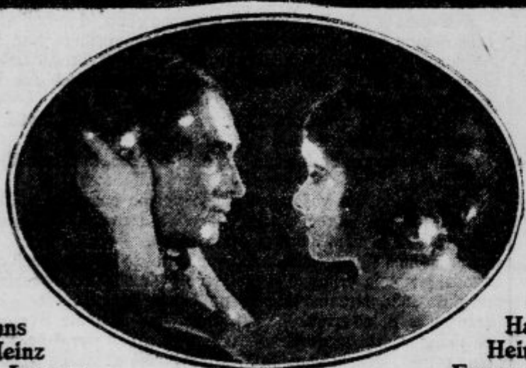
Hanns Heinz Ewers; Hanns Heinz Ewers;