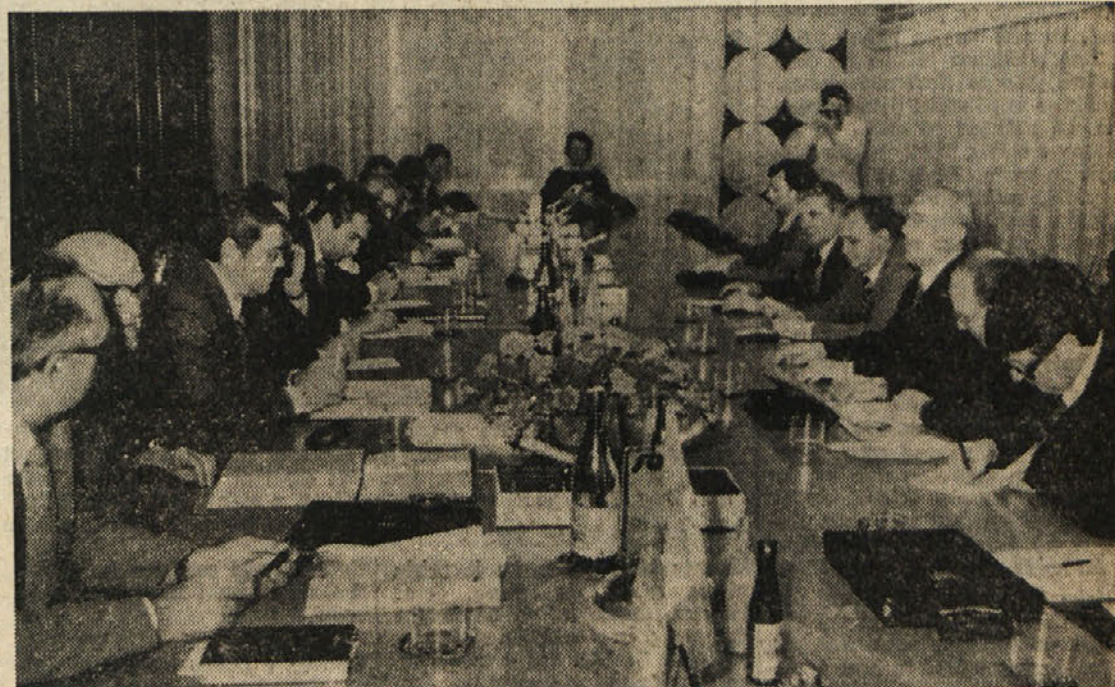
Delegaciji SZDL Nova Gorica in KD goriške pokrajine med pogovori v prostorih Ljubljanske banke v Novi Gorici

Obveza krščanske demokracije, da se bo zavzela za globalno zakonsko zaščito Slovencev - Obisk cementarne Anhovo