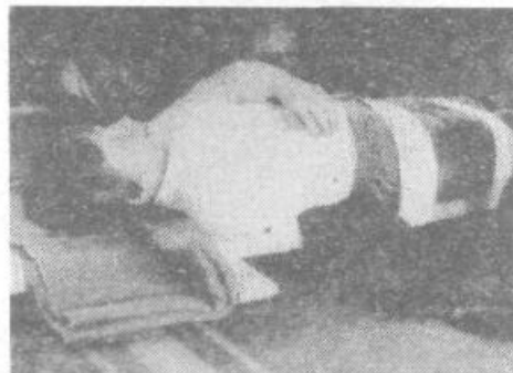
Mlademu poškodovancu so nudili prvo pomoč

Toda, če so se že pripadniki CZ in RK bali maske, pa je med učenci po drugi strani vzbujal največ strahu orientacijski pohod po 4 km dolgi progi prek Golovca, kjer jih je čakalo 8 kontrolnih točk, s časovnico 70 minut.