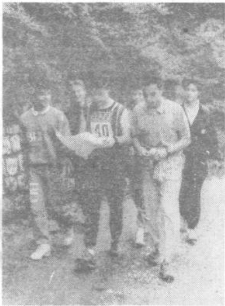
Orientacijski pohod je od mladih terjal veliko znanja pa tudi vzdržljivosti