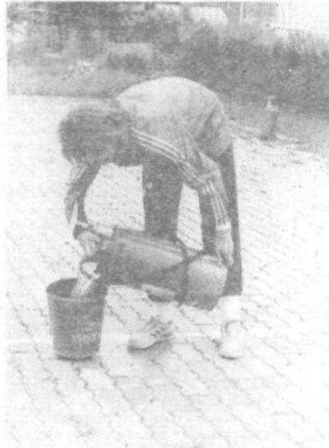
Vaja z vedrovko