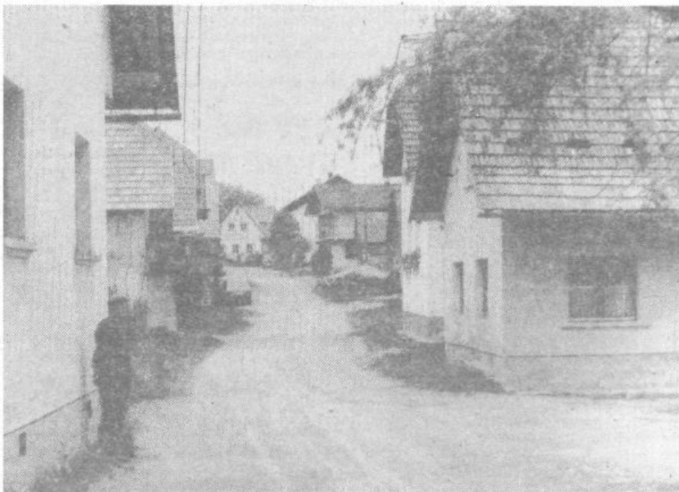
Dvorska panorama: staro se kar se more smakniti novemu

Farni zapiski in starjši krajanji vedo povedati, da je v Dvorski vasi že pred vojno šlo marsikaj narobe. Dvor-