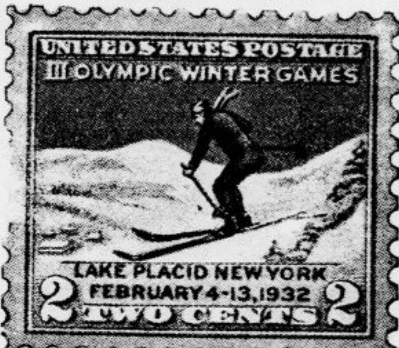
Ameriška pošta je izdala o priliki zimске olimpijade v Lake Placidu posebne znamke