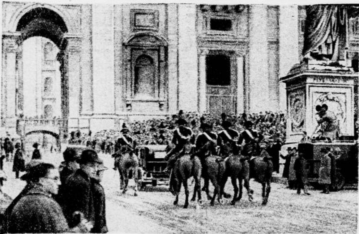
V spremstvu svoje telesne garde na konjih se je podal italijanski ministrski predsednik k papežu