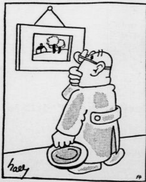
Kako neznanstvo matnen je človek v primeru z veliko materjo naravo!