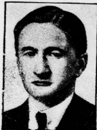
Minister Strasburger, poljski zastopnik v Gdanku, je podal ostavko na svoje mesto