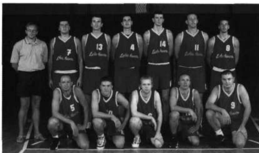
Slika 16: Ekipa, ki si je priborila nastop v pokalu Radivoja Korača 1999

Leta 1999 je KZS iskala organizatorja za jubilejno 20. evropsko prvenstvo v košarki za mladinke. V klubu smo ocenili, da bi kar nekaj naših takratnih pionirk lahko sodelovalo v reprezentanci Slovenije. IO KK Odeja-Marmor je soglasno sprejel odločitev, da kandidiramo za omenjeno prvenstvo. Odločitev je bila že tedaj usoglašena z vodstvom Občine Škofja Loka. Danes lahko ocenimo, da je bila pravilna.