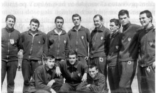
Slika 6: Igralci iz leta 1964