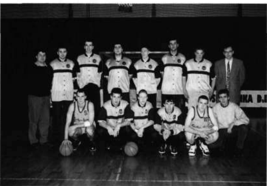
Slika 15: Ekipe, ki se je uvrstila v I. A SKL

gih uvrstili na odlično peto mesto. Po dodatnih desetih tekmah play-offa je bil končni vrstni red državnega prvenstva naslednji: Union Olimpija, Pivovarna Laško, Krka, Kovinotehna Polzela, ZM Lumar, Loka Kava. Res sijajen uspeh!