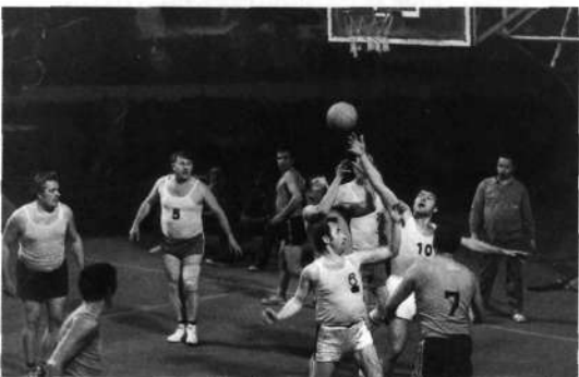
Slika 10: Veterani Loke in Medvod v zagrizeni borbi

Jeseni 1984 so se nadaljevale različne akcije in prireditve v proslavo 30-letnice košarke v Škofji Loki. V tekmovalnem delu je bila odigrana propagandna tekma z Olimpijo, tekme so odigrale vse ekipe v klubu. Mlajše ekipe so igrale z vrstniki in vrstnicami iz Žirov in Gorenje vasi. Za krono teh tekmovanj so se pomerile ekipe veteranov Škofje Loke, Jesenic in Medvod, in sicer igralcev, ki so se med seboj merili že leta 1954 in v naslednjih letih.