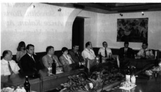
Slika 17: Predstavniki sponzorjev košarkarskega kluba