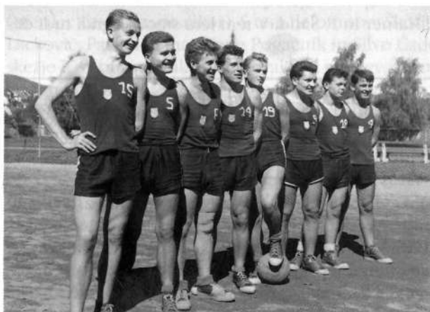
Slika 3: Ekipa iz obdobja 1957/58

Odvzeli so nam eno točko, saj smo tekmo s Proletarcem iz Zagorja administrativno izgubili z rezultatom 20 : 0. Tedaj je največ igrala ekipa, ki jo vidimo na sliki 3.