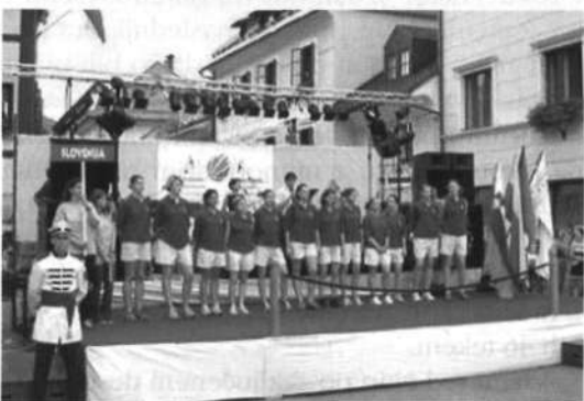
Slika 18: Slovenska reprezentanca na otvoritveni slovesnosti