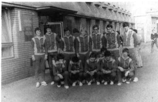
Slika 8: Članska ekipa v I. SKL