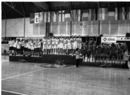
Slika 20: Podelitev medalj najboljšim na zaključni slovesnosti

V upanju, da se bo naša ženska ekipa v sezoni 2002/2003 kot najmlajša udeleženka lige uvrstila med šest najboljših v Sloveniji in moška članska ekipa čim prej ponovno uvrstila v I A SKL, zaključujemo košarkarsko zgodbo zrelih let.