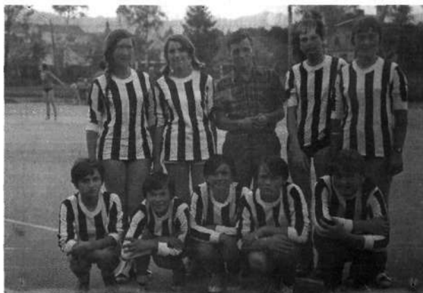
Slika 7: Ženska ekipa iz časa 1967/68

Ženska ekipa, ki je do tedaj tekmovala le v mladinskih selekcijah, je to leto igrala tudi med članicami. Igrale so pod vodstvom Jurija Krajnika in zasedle 4. mesto na Gorenjskem. Jedro te mlade ekipe vidimo tudi na sliki 7.