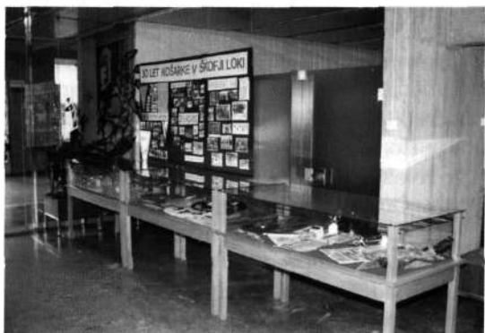
Slika 7: LB - razstava ob 30-letnici

Šk. Loki, je bila v maju 1984 v veliki avli Ljubljanske banke (LB) in je vzbudila dosti zanimanja (glej sliko 7), kasneje smo jo prenesli v zgornjo avlo v hali Poden. Izdali smo jubilejne nalepke, serijo jubilejnih značk in posebne reklamne transparente.