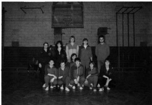
Slika 11: Dekleta generacije 1984/85, ki so igrale v II. SKL.

Za te je strokovni svet postavil cilj, da se najkasneje čez tri leta znova uvrstijo v I. SKL, t. j. najvišjo ligo v republiki.