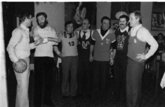
Slika 2: Župan, direktorji,...

Iz te izjemno uspele in odlično organizirane prireditve so se v na-