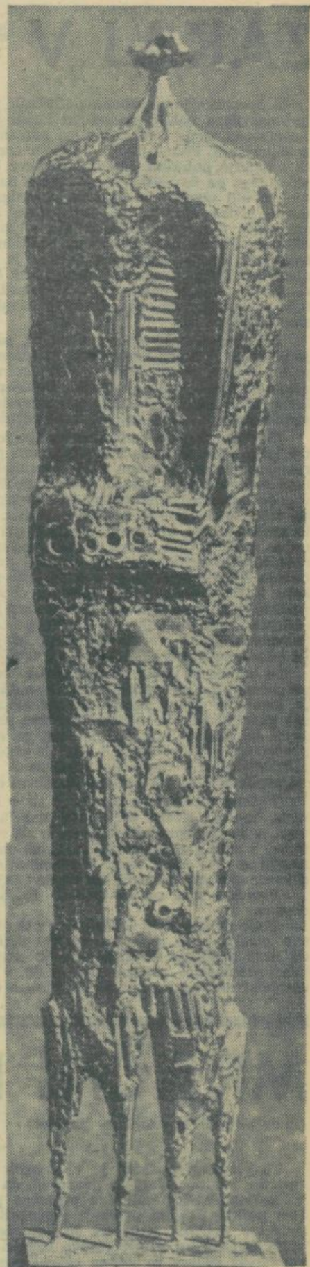
Tone Lapajne, Barjanec