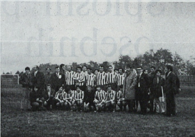
Nogometaši EMONE z navijači

Največ aplavza so poželi naši kegljači, saj so že prvi dan tekmovanja na 100 lučjev vodili s prednostjo 250 podrtih kegljev pred drugo najboljšo ekipo. Ta prednost je drugi dan narasla na 350 kegljev. Pred zadnjo ekipo pa so vodili celo za 2000 podrtih kegljev. Končna uvrstitev ekip: