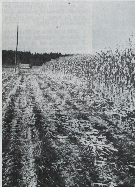
Silažna kuruza je osnova prehrane 900 krav molznic. Letos je bila spravljena ob ugodnem vremenu