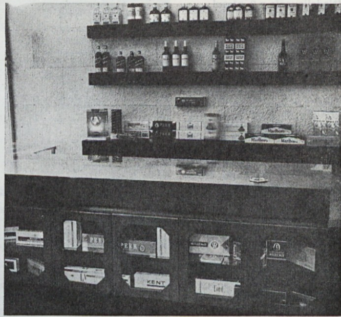
Pijače in tobačni izdelki predstavljajo začetek zastopniške dejavnosti v našem podjetju

143. člen — Za mestni promet se štejejo vse tiste relacije, na katerih velja enotna tarifa 0,60 din.