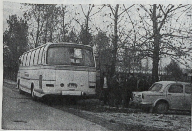
Pred odhodom z Globtourovim avtobusom iz Mesne industrije Zalog

Malo zaskrbljeni, vendar športno navdušeni in z obilo volje, smo se odpravljali na pot, kajti pričakovali smo le malo dobrih uvrstitev glede na izredno kratke priprave, predvsem pa glede na to, ker