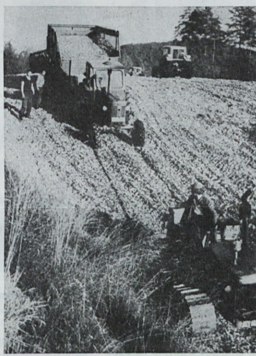
Siliranje zrezane kuruze v silos

Na iniciativo delavskega sveta Mesna industrija »Gavrilovič« se je dne 16. 10. 1970 odvijala v Petrinji prva konferenca samoupravljalcev naše stroke.