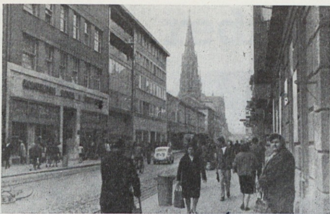
Osiček je prijetno mesto