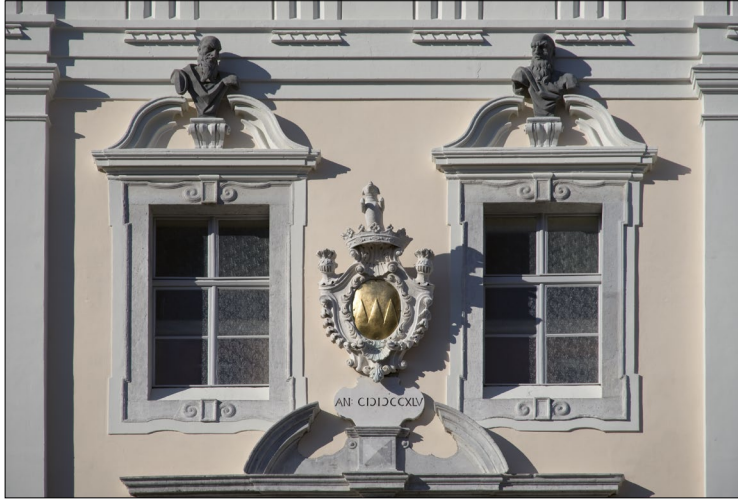
2. Grb na fasadi, 1745, palača Attems Petzenstein, Gorica