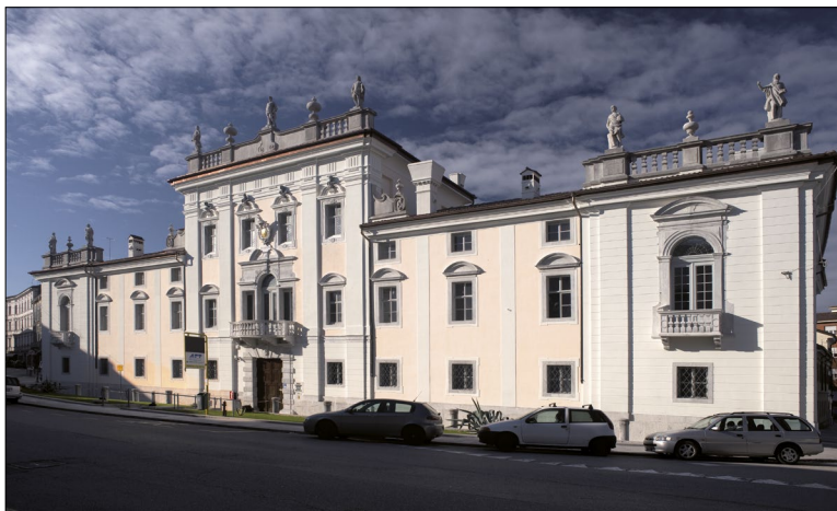
4. Palača Attems Petzenstein, Gorica