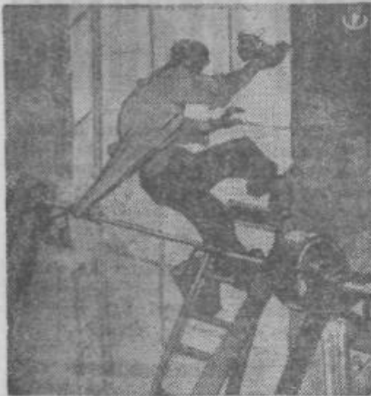
Tudi gladke osi lahko zagrabi obleko

Zato: storimo vse, da se bo število profesionalnih nezgod občutno zmanjšalo.