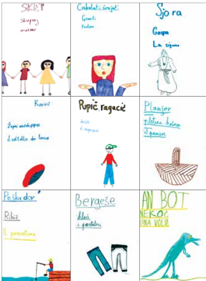
Slika 4: Nekaj strani iz slovarja.

V slikanici Tonin najdemo narečno besedo štrigon – čarovnik. Večina učencev narečja ne pozna, zato so tisti, ki ga dobro poznajo, predlagali, da bi naredili narečni slovar. Izbrali smo narečne besede, ki so uporabljene v