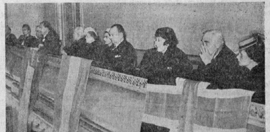
Diplomatični predstavniki prijateljskih držav s soprogrami na javnem zboru ob priliki proslave kraljevega rojstnega dne