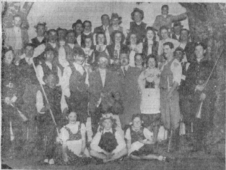
Skupina igralcev "Slovenskega doma" v igri "Divji lovec"

Jugoslovanska narodna obrana bo letos priredila proslavo našega narodnega praznika ter se bo ista vršila v soboto 29. novembra ob 9 uri zvečer, v dvorani "Unión Tranvia-