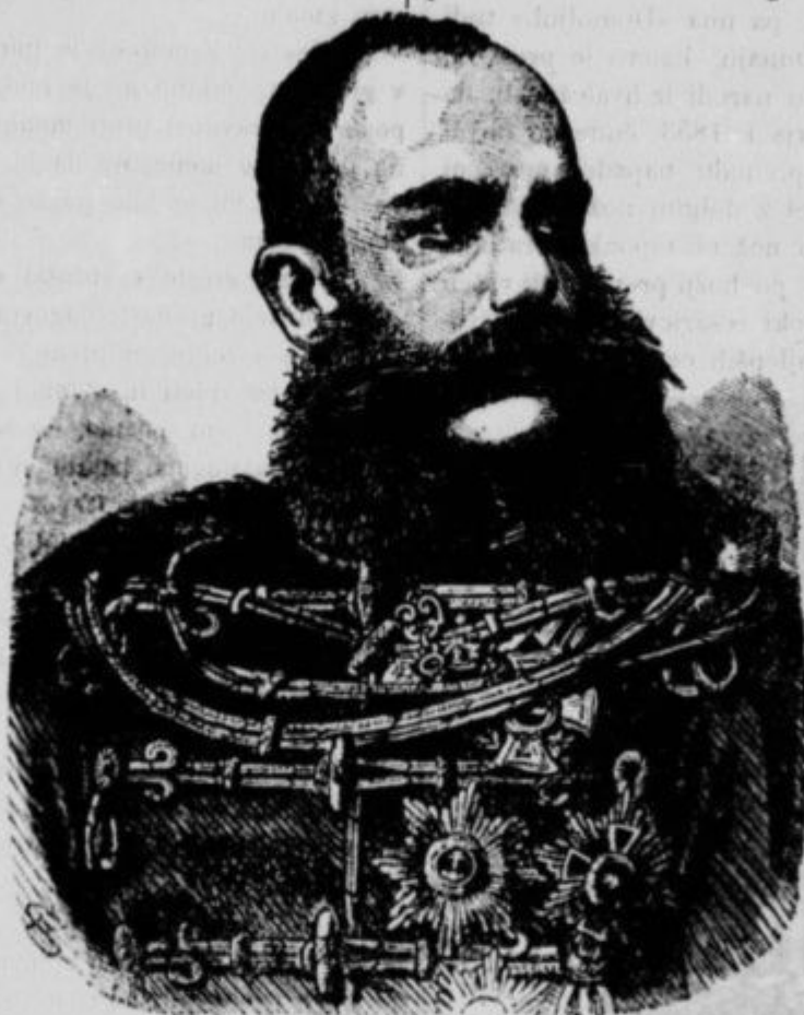
Cesar Franc Jožef I.