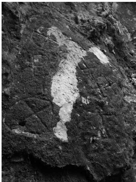
Slika 4: Petroglifi na vhodu v jamo/pečino Loza I – Loza Brgujčeva v bližini Pasjaka na Hrvaškem (Fotografija: Katja Hrobat Virloget).

o njeni uporabi v času mezolitika, bronaste dobe, pred 5. stoletjem n. št. in v času pozne antike (Starac 2011: 28). Za razliko od vrezov v Jami ob Trnovskem studencu so ti vrezi zelo razločni in pravilni, med njimi je tudi simbol P in simbol stilizirane človeške figure, stran od te skupine simbolov je vrezana (najbrž) letnica 1912.