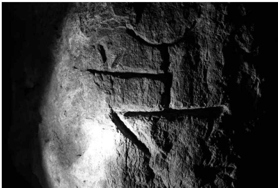
Slika 2: Strelec/konjenik?