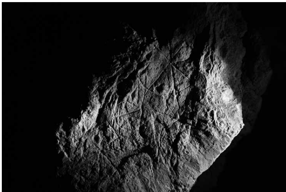
Slika 3: Vrezi prekrizanih krogov na preostalem delu kapnika.