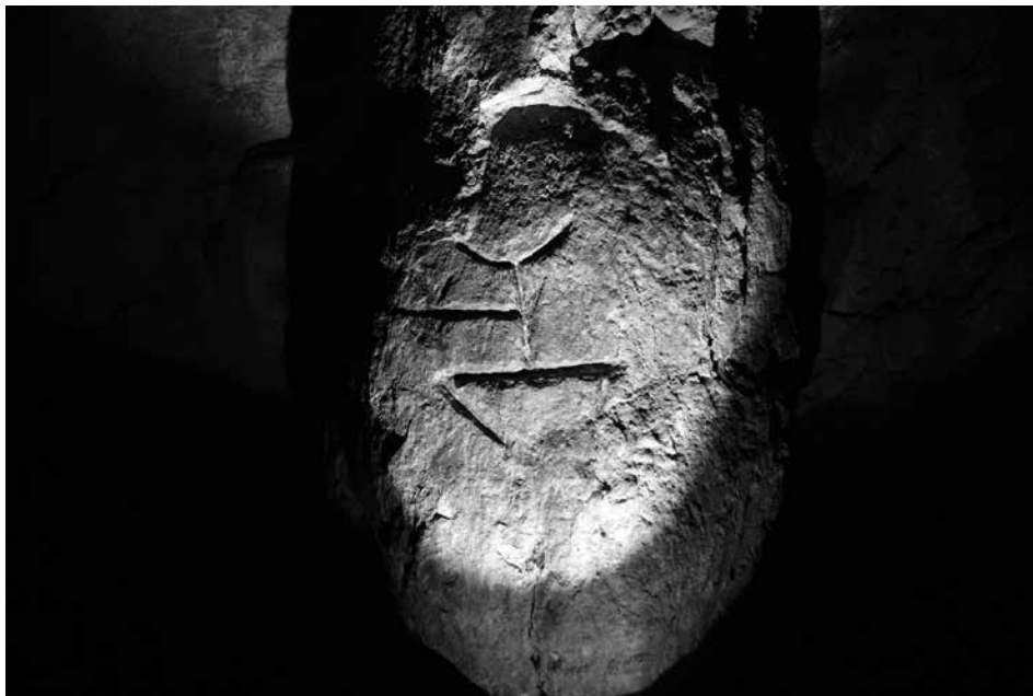
Slika 1: Falusoidna podoba kapnika s petroglifi iz Jame ob Trnovskem studencu nad Ilirsko Bistrico.

Zaradi oblike je najbolj vznemirljiv petroglif ta, ki deluje kot antropomorfini lik. Za razliko od preostalih petroglifov je edini, ki deluje skrbno, natančno in bolj globoko vrezan. Na prvi pogled resda deluje kot stiliziran strelec z lokom, pri čemer bi bili nogi stilizirani v razkoraku, okroglina glave zgolj nakazana, z iztegnjeno roko, v kateri si lahko