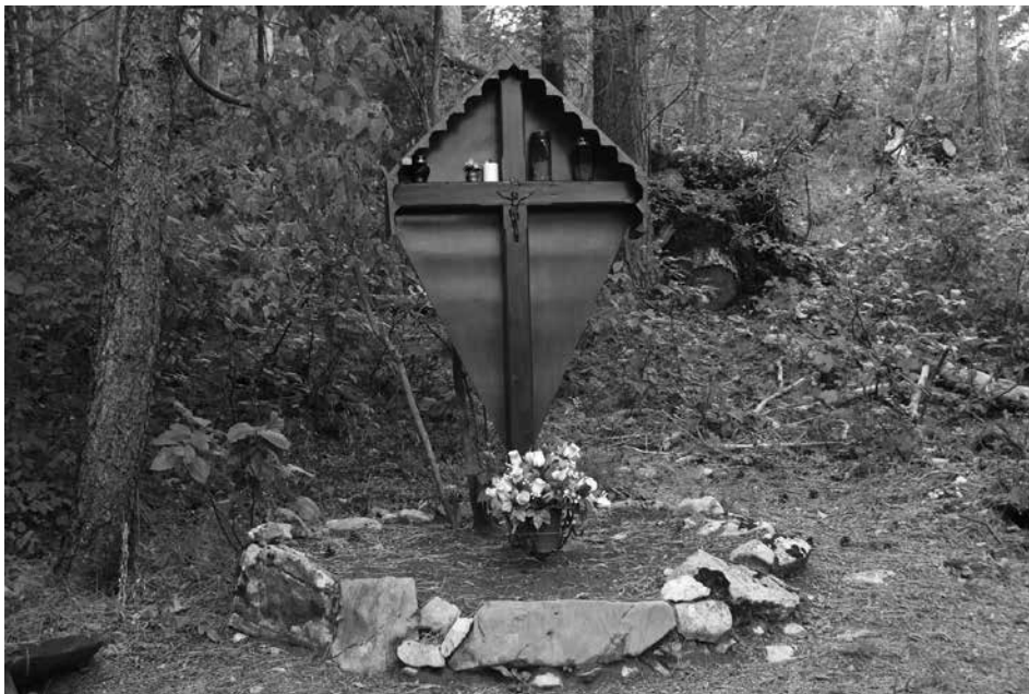
Slika 6: Lesen križ ob Trnovskem studencu v bližini jame s petroglifi.