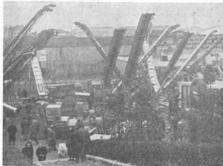
Gozd kmetijskih strojev na velesejmskem prostoru...

Zal so vzorno kmetijstvo severne Italije videli tisti ljudje, ki že dokaj dobro vedo, kako je treba. Upajmo pa, da bodo udeleženci z živo besedo lahko našim kmetovalcem posredovali svoje vtise iz dežele, kjer ekonomika kapitalističnega sistema neusmiljeno postavlja kmeta pred odločitev: Napredna proizvodnja, ali pa nelzbežen propad v korist veleposestniških izkoriščevalcev.