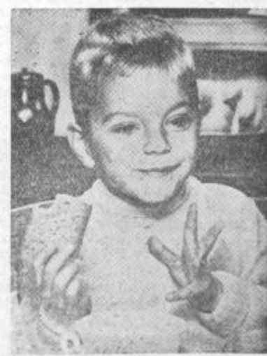
V obratu družbene prehrane ali ne — Jaaczu tekne povsod