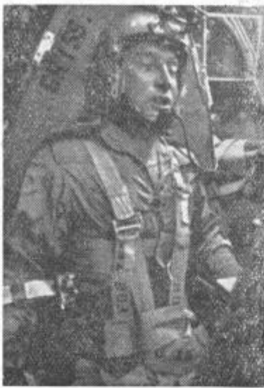
... medtem pa se ameriški poizkusni pilot že leto dni pripravlja na polet v umetnem satelitu okoli zemlje

James Watt je pred 200 leti iznašel parni stroj, pred tremi leti pa je prvi sovjetski »sputnik« šinil v neslutene višave. Se zdaj zavedamo pomembnosti konice v piramidi človekovega napredka?