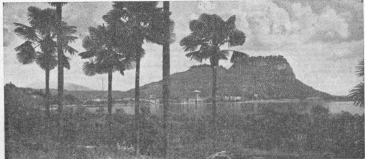
Ob ledeniskem jezeru Lago di GarJa rasto palme, olive in ciprese...

Hoteli ob jezeru, vsaj v Gardi sami, so zgrajeni za poletni čas. To smo ob hladnem vremenu počeno občutili. Toda čemu bi gradili stavbe z močno toplotno izolacijo, če pozimi ni gostov? Nisem videl hotela, ki bi bil bolj luksuzen od naših, zlasti po ureditvi gostinskih prostorov. Pač pa imajo vse sobe tuše, bideje in za Italijo neizogibne balkone. Italijani so mojstri v ure-