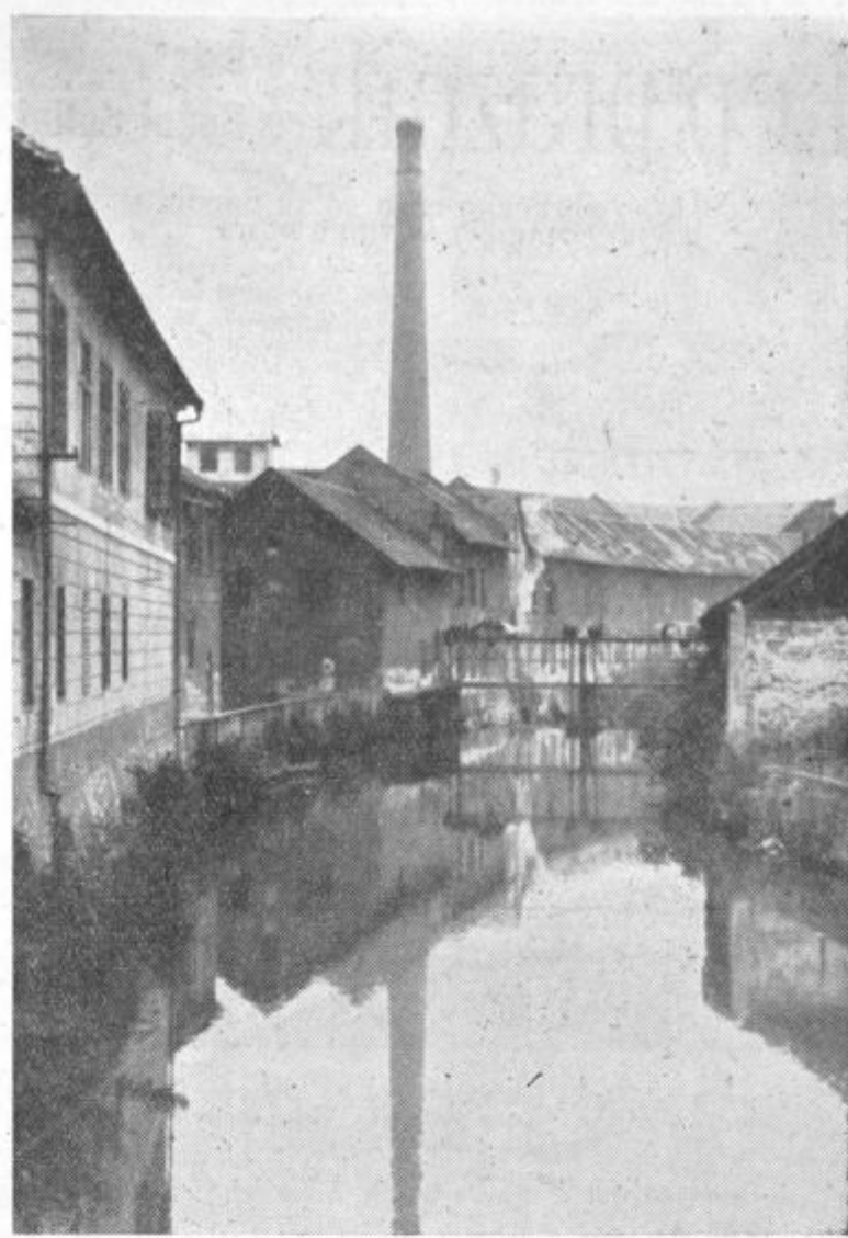
Ob tovarni usnja v Soštanju

Občni zbor je lepo uspel ne samo zaradi pozitivne bilance lanskega poslovanja v podjetju, ne le zaradi drugih uspehov, ki se kažejo na najrazličnejših področjih, temveč tudi v tem — in to je ena najbolj značilnih in pozitivnih ugotovitev — da so člani sindikalne organizacije prekoračili meje ozkega reševanja svojih »internih« problemov in posegli