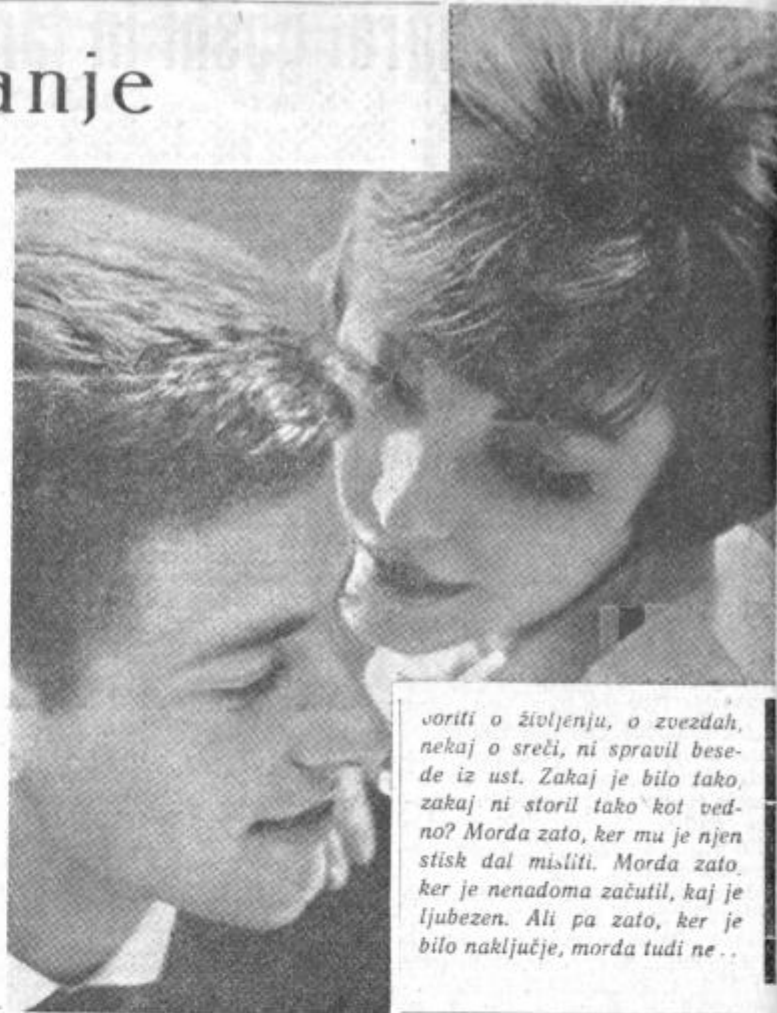
Govoriti o življenju, o zvezdah, nekaj o sreči, ni spravil besede iz ust. Zakaj je bilo tako, zakaj ni storil tako kot vedno? Morda zato, ker mu je njen stisk dal misliti. Morda zato, ker je nenadoma začutil, kaj je ljubezen. Ali pa zato, ker je bilo naključje, morda tudi ne...

Gotovo se je šalil. Rahlo je zardela in ponudila roko. V stisku je bilo nekaj, kar ga je čisto rahlo, pa vendar dovolj močno, presenetilo. Bilo je to zanj nekaj novega, neznanega in prav zato morda velikega. In ko je spet hotel sprego-