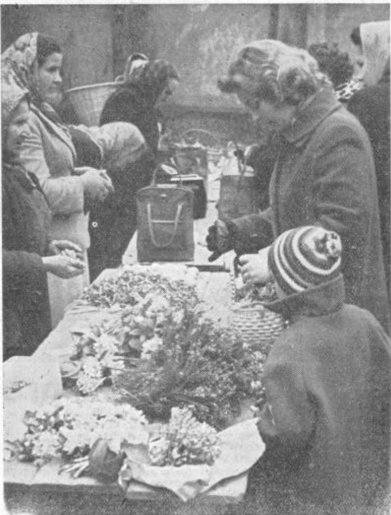
Tudi na trgu je pomlad