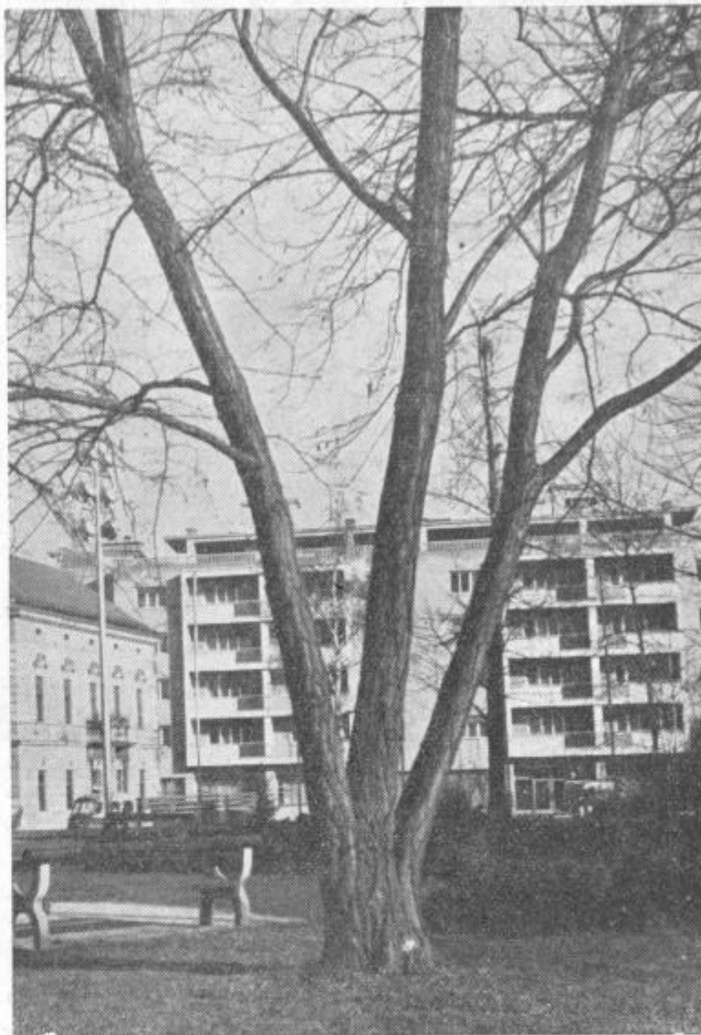
CELJE V MARCU