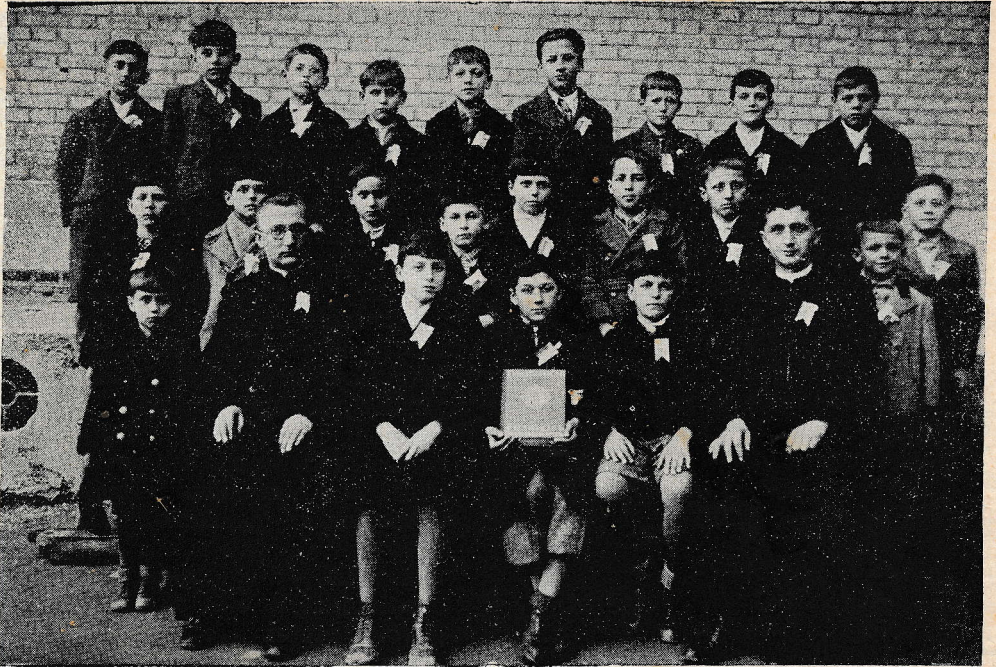
Tekmovalci iz katekizma v oratoriju na Rakovniku.

z njimi se je najrajši pogovarjal ter jim ljubeznivo nagajal. Bil je zares blaga in zlata duša. Pri don Bosku naj uživa plačilo in pri Mariji Pomocnici. Do njiju je gojil iskreno otroško ljubezen.