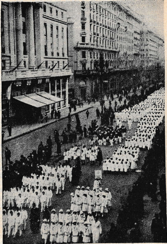
Prizor iz pohoda 15.000 mladine ob 60. letnici salezijanskega dela v Argentini.

Sonce je zahajalo vse krvavo in metalo rdeče žarke na ono zemljo, celo zelenje dreves se je pordečilo — vse je spominjalo na kri, ki se je ondi prelila. Naši misijonarji se niso mogli strpeti in počakati naslednjega dne, še zvečer so povესlali na onstran reke ter se povzpeli po navpičnem bregu tja, kjer je stal skromen križ, pred njim pa izkopana zemlja. Tu sta na-