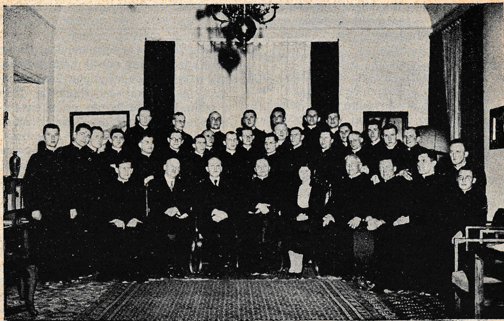
Salezijanski bogoslovci na obisku pri češkoslovaškem konzulu.