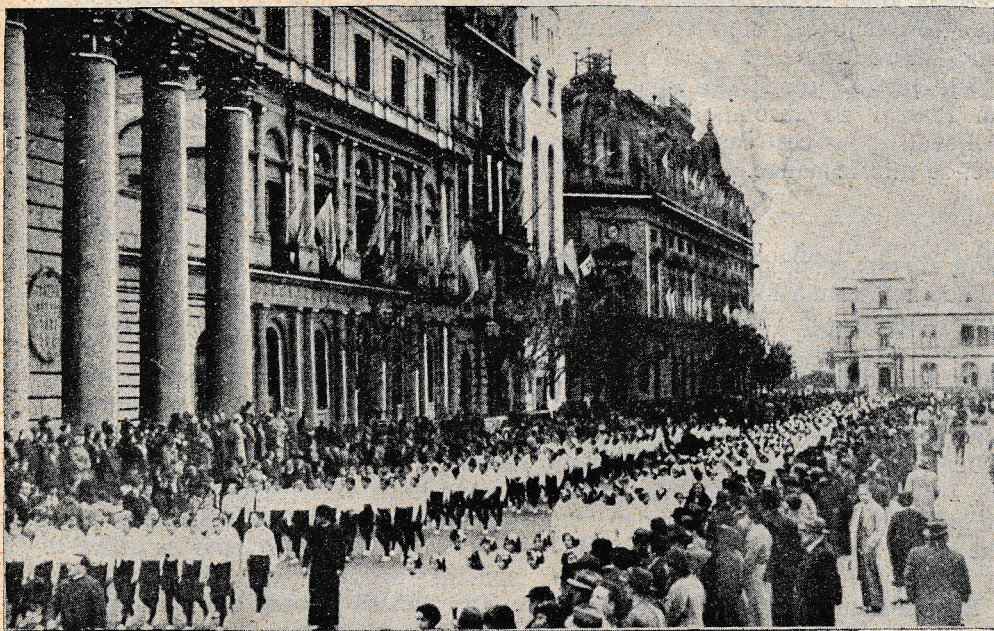
Salezijanska mladina na ulicah Buenos Ayresa.