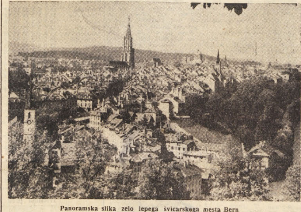
Panoramska slika zelo lepega švicarskega mesta Bern

Lahkoverneži in verski fanatiki, ki bodo imeli opravka s kazenskim zakonikom, ali pa s psihiatri v umobolnicah