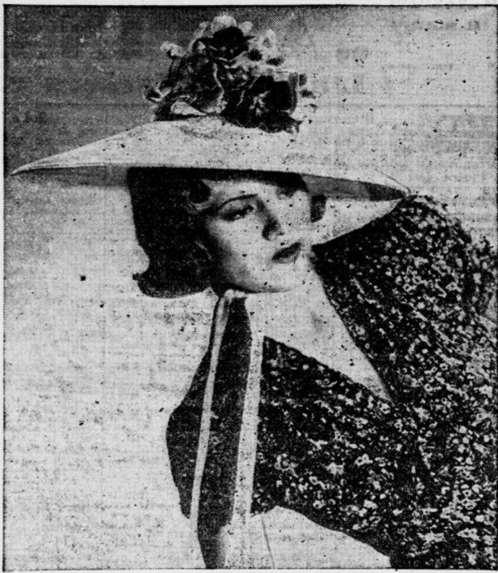
Paroki klobuki iz ameriške slame so letos zopet moderni in jih nosijo vse filmske divje v Hollywoodu (slika).