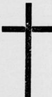
Mestni pogrebni savod Občina Ljubljana

V globoki žalosti javljam, da me je danes zapustil moj nad vse ljubljeni soprog, gospod