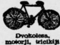
Dvokolesa, motorji, tricikla