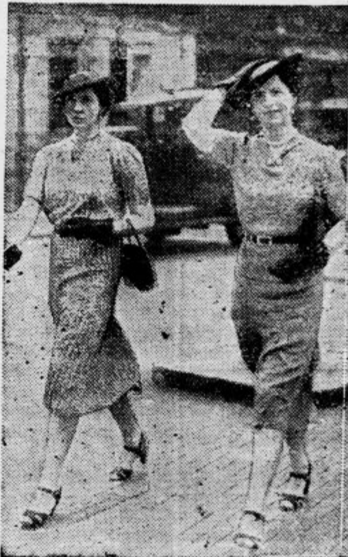
Princesa Helena, prejšnja soproga rumunskega kralja Karola (na desni) in njena sestra Irena sta pred dnevi prispeli v London, baje zaradi pogajanj za spravo z odposlancem kralja Karola v Londonu