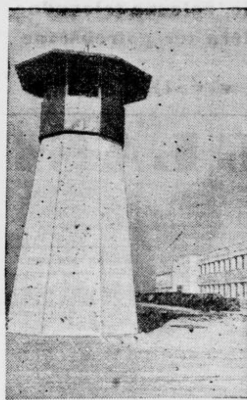
Na Terminal Islandu pri Los Angelesu je Amerika zgradila novo moderno jetišnično, obdano s posebnimi opazovalnimi stolpi, kakršnega prikazuje naša slika