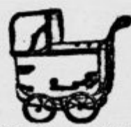
Oročni vozički najnovejših modelov

8 jutrov polja s sadnim in zelenjadnim vrtom pripravno za vrtnarstvo, T A K O J zaradi odpotovanja poceni NAPRODAJ. Vprašati pri KNEZ, Zgornji Breg — Ptuj.