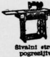
Šivalni stroji pogrešljivi