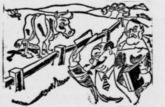
»Zdaj pa pozdravljajte« Zdravstveno »Če dovolite — to je mo. in pacienčak« (Rič et Rač)