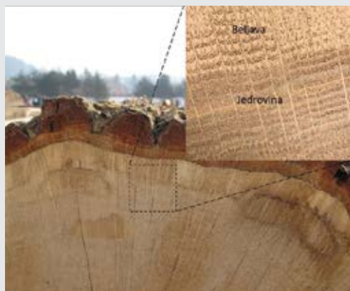
Slika 3: Prečni prerez debla hrasta, kjer lahko na perifernem delu opazimo svetlo beljavo, v notranjosti debla pa temnejšo jedrovino ali črnjavo (Foto: P. Prislan).

Slika 2: Mikroskopske značilnosti hrastovine. (a) Prečni prerez ranega lesa s trahejami (rT) premera nad 200 µm, ki jih obdajajo tankostene vazicentrične traheide (VT). Lumne trahej pri hrastu pogosto zapolnjujejo tile (T). Enoredni trakovi (eTr) se v ranem lesu zaradi velikosti trahej odklonijo. (b) Prečni prerez kasnega lesa s trahejami (kT) velikosti okoli 50 µm, ki jih obdajajo tankostene vazicentrične traheide. Dobro so vidni skupki debelostenih libriformskih vlaken (LV). Aksialne parenhimske celice (Ap) so najbolj vidne med skupki debelostenih libriformskih vlaken, saj imajo značilno ovalno obliko in tanko celično steno. (c) Na radialnem prerezu so dobro vidni posamezni trahejni členi (Tc), ki sestavljajo trahejo. Dobro je viden homogen trak (eTr), s trakovnimi parenhimskimi celicami enake oblike in velikosti. (d) Širok (šTr) in enoredni trak (eTr) na tangencialnem prerezu. V trakovnih parenhimskih celicah so prisotni romboidni kristali (Kr) kalcijevega oksalata. (e) Piknje med trakovi in trahejami vidne na radialnem prerezu so velike in okrogle. (f) Piknje v vazicentričnih traheidah (P-VT), ki pomagajo pri prevajanju vode, ter piknje v relativno kratkih aksialnih parenhimskih celicah (P-Ap) vidne na radialnem prerezu (Foto: P. Prislan).