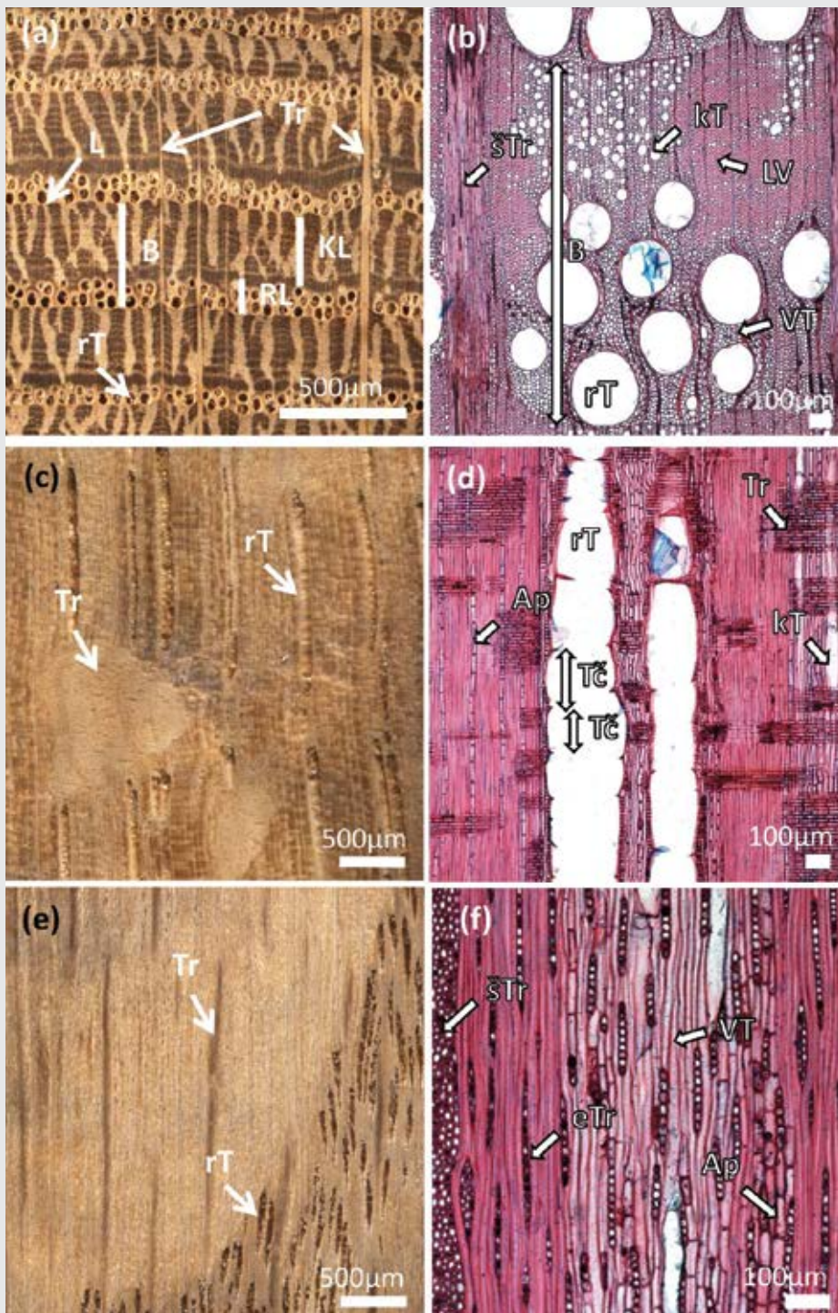
Slika 1: Makroskopska (a, c, e) in mikroskopska (b, d, f) zgradba lesa hrasta: (a) Na prečnem prerezu so dobro vidne letne prirastne plasti ali branike (B). Zaradi razlik med ranim (RL) in kasnim lesom (KL) so letnice (L) različne. S prostim očesom so zelo dobro vidni široki trakovi (sTr); (b) Pod mikroskopom lahko opazimo, da rane (rT) in kasne traheje (kT) obdajajo tankostene vazicentrične traheide (VT). Dobro so vidna tudi debelostena libriformska vlakna (LV). Skupki kasnih trahej (kT) ter vazicentričnih traheid (VT) tvorijo svetleša plamena, ki jih obdaja temnejše tkivo iz libriformskih vlaken. (c) Na radialnem prerezu so letne prirastne plasti nekoliko slabše vidne, široke trakove na radialnem prerezu opazimo kot markantna temnejša zrcala, dobro so vidne tudi traheje ranega lesa (rT). (c) Pod mikroskopom lahko na radialnem prerezu opazimo relativno kratke trahejne člene (Tc). Dobro so vidne tudi kratke in tankostene aksialne parenhimske celice (Ap). (d) Na tangencialnem prerezu so trakovi vidni kot izrazita vretena, vidne pa so tudi traheje ranega lesa. (f) Pod mikroskopom so dobro vidne razlike v velikosti širokega (sTr) in enorednega traku (cTr).