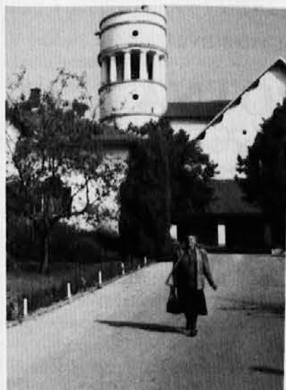
Plečnikova cerkev v Bogojini