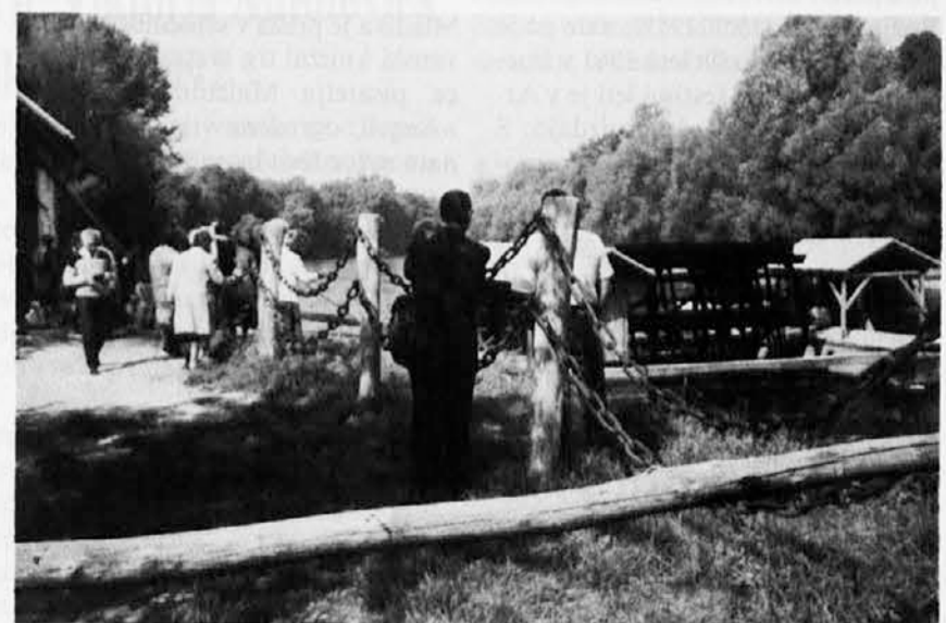
Edini še delujoči mlin na Muri