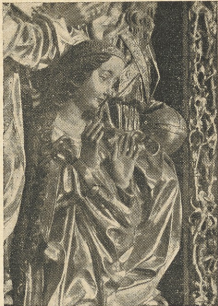
Marija na Zilji

Ob branju tega ganljivega poglavja v brevirju se je dušebrižnik spomnil svoje edine javne sovražnice, Sršenke, in premišljal, ali ne bi bilo dobro na-