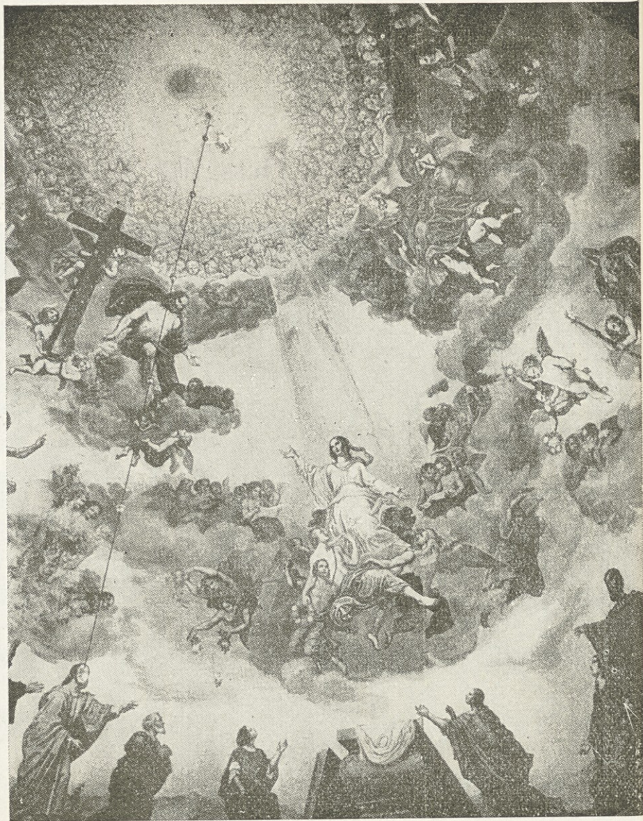
Marijino Vnebovzetje v kupoli romarske cerkve na šmarni gori, delo M. Langusa Naslovna stran: Marija z Brezij v oknu župne cerkve v Floridi (Vel. Buenos Aires)