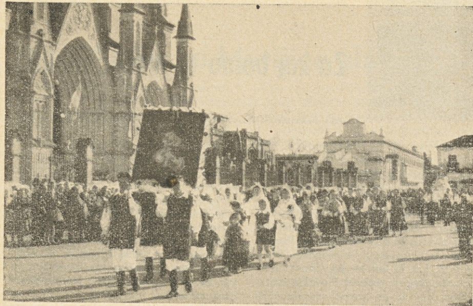
Med molitvijo in petjem se je pomikala procesija slovenskih romarjev ob priliki letošnjega romanja v Luján (Argentina — 12. maja) v baziliko

al parecer colosales, se derrumban inexorablemente al empuje de las pasiones.