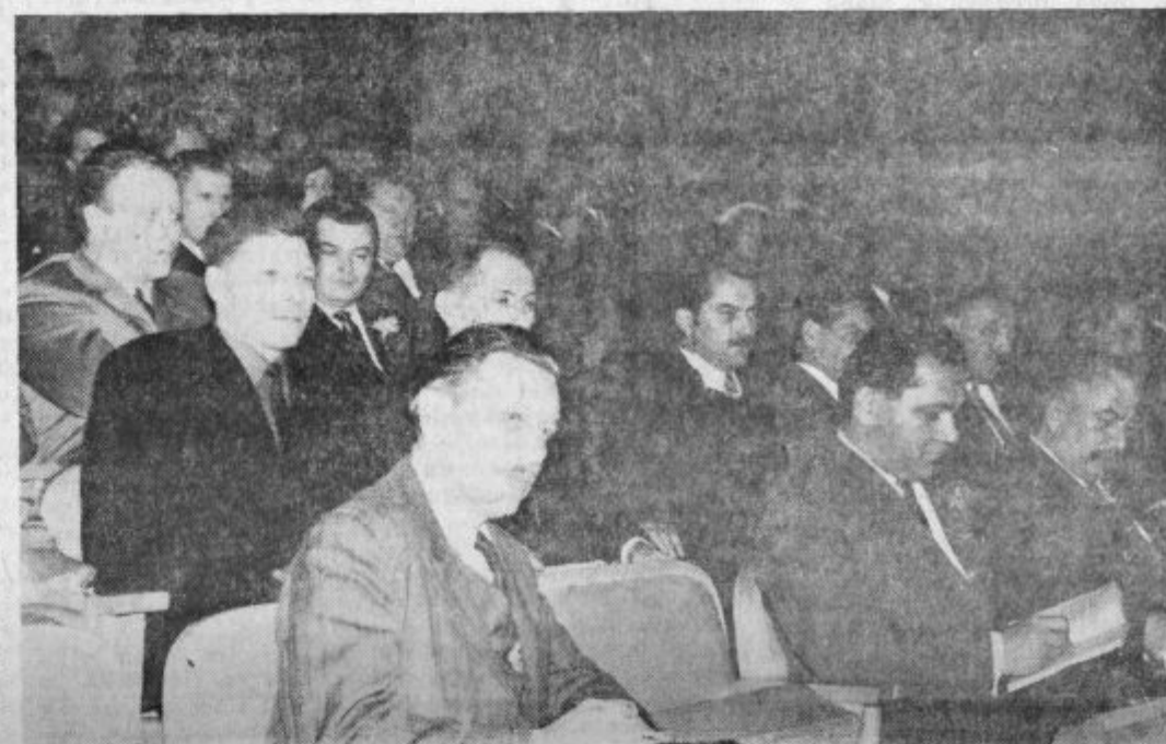
Gosti in delegati na sindikalnem občnem zboru

Izvršni odbor občinske konference SZDL je predlagal občinski skupščini, da uvede v velenjski občini samoprispevek, ki bi ga v petih letih plačevali občani od svojih dohodkov, in v ta namen razpiše ljudsko glasovanje. Sredstva, zbrana s samoprispevkom občanov, pa naj bi uporabili za gradnjo ali obnovo šol in modernizacijo cest.