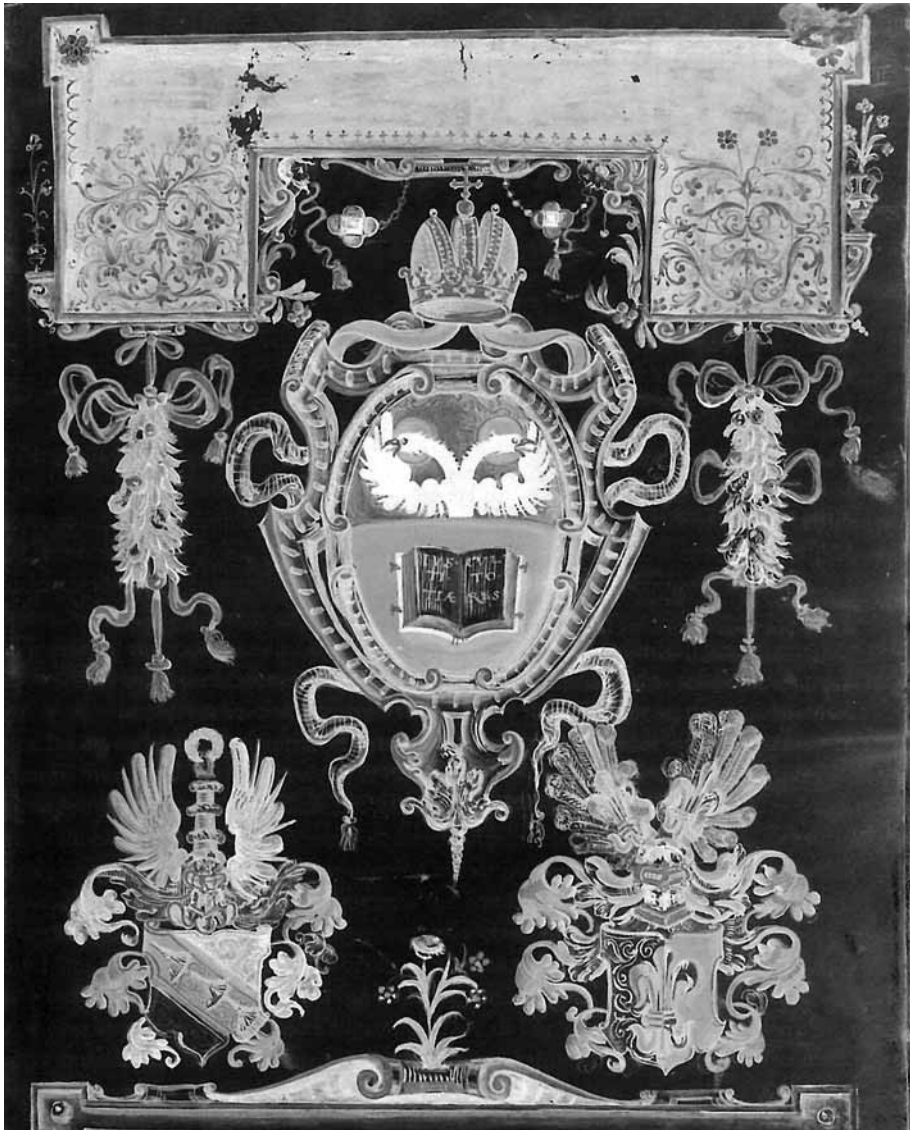
Slika 1: Miniatura z grbom bolonjske nemške nacije v sredini, izsek. Liber inclytæ Germanicæ Nationis , c. Ilr (obj. v: La Matricola , str. 83).

ena nemška nacija, 10 medtem ko se je v Padovi nemški naciji študentov prava, t. i. juristov, leta 1553 pridružila nemška nacija artistov, tj. študentov tamkajšnje artistske fakultete. 11 Padovska natio Germanica artistarum je združevala slušatelje fi lozofi je, medicine in teologije, njen nastanek pa je bil v prvi vrsti posledica rasti števila »nemških« študentov tako na pravni kot na artistski fakulteti (tu še posebej