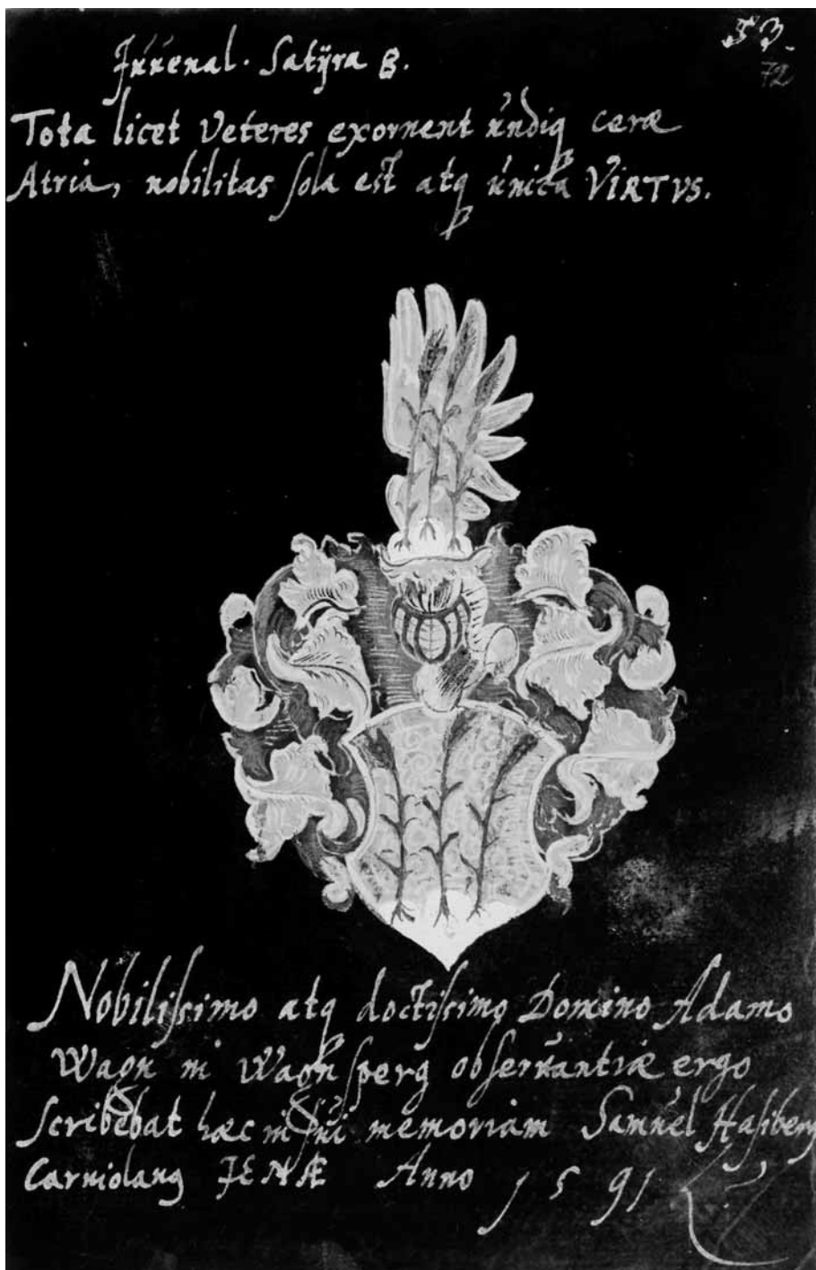
Slika 4: Posvetilo Samuela Hasiberja Adamu Wagnu z Bogenšperka, tedaj študirajočemu v Jeni, 1591 (ARS, SI AS 1073, 31r, fol. 53 [p. 72]).