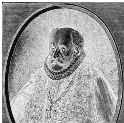
Slika 6: Janez Kobenzl, rojen 1530 v Štanjelu, umrl 1594 v Regensburgu.

Forhtenek pri Šoštanju; leta 1575 sta imela Jurijeva brata Viljem in Ferdinand poleg forhteneškega gospostva v zastavi tudi deželnoknežji urad Žalec. 298