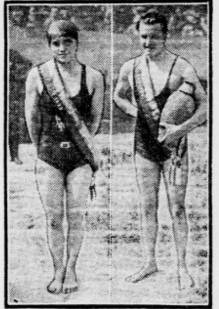
Dva plavalna šampijona

Londonski list »Star« je naslovil na zdravnike vprašanje, kako to, da so našli v londonskih muzejih čestokrat osebe, ki so ob samem gledanju kakšne slike zaspale. Strokovnjaki so odgovorili, da ni to nič neobičajnega. Vzrok niso umetnine, temveč posebna sestava muzejskega ozračja. To ozračje vpliva na živčevje celo takšnih oseb, ki trpijo na nespečnosti, tako močno, da zaspajo.