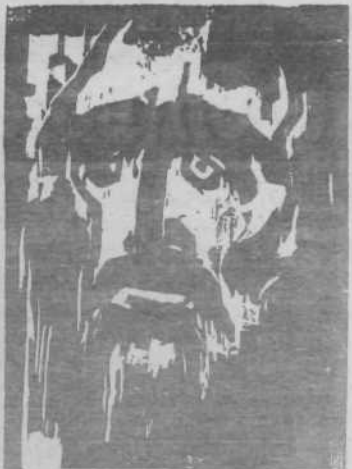
Emil Nolde: Pevnik. 1922