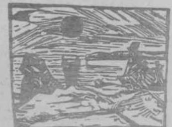
Erich Heckel: Rojstvo sonca. 1914

Do 20. oktobra si lahko v razstavnih prostorih Cankarjevega doma ogledamo razstavo grafik nemških ekspresionistov Maxa BECKMANA, Otta DIXA, Lyonela FEININGERJA, Ericha HECKLA, Otta MUELLERJA, Emila NOLDEJA Maxa PECHSTNERJA in Karla SCHMIDTA.