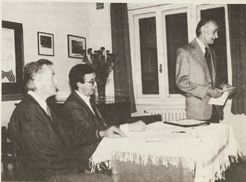
■ Društvo Slovencev miljske občine je imelo 10. novembra občni zbor.