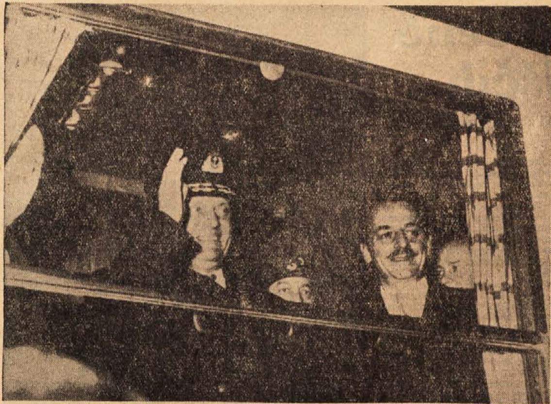
Predsednik republike Josip Broz-Tito z državnim tajnikom Kočo Popovičem v »belem vlak«, ki je jugoslovanske goste peljal iz Carigrada v Ankaru