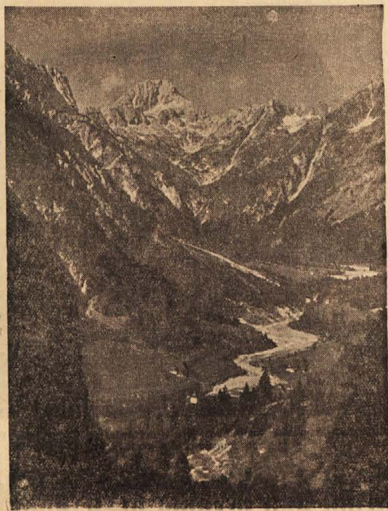
Prelepa dolina Trente bo tudi letos privabila mnogo turistov

Kakor vse kaže, bo vprašanje zaračunavanja amortizacije v sezonskih gostinskih podjetjih, rešeno na ugodnejši način. Zvezni zavod za plan je že predložil Zveznemu izvršnemu svetu predlog, po katerem naj bi se amortizacija zaračunavala samo za tisto razdobje, v katerem gostinsko podjetje posluje, in ne za vse leto. Tak način obračunavanja bi omogočil znižanje penzijskih cen za okrog 100 din na dan, v nekaterih podjetjih manj, v drugih več, kajti v najboljše opremljenih sezonskih gostinskih podjetjih bi predlagani način obračunavanja amortizacije omogočil znižanje cen tudi za 150 din na dan. F. S.