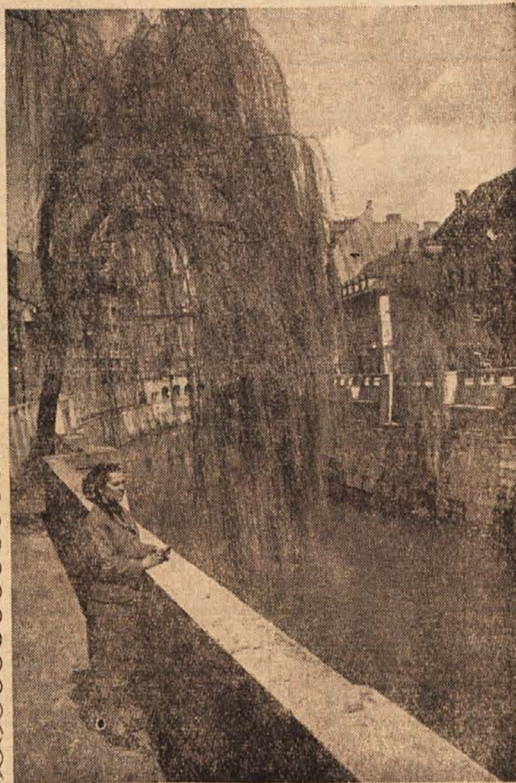
Ob Ljubljanci so sprehodi ob sončnih popoldnevih prijetni

Rezervni članski okraja Radovelca so imeli v nedeljo na Bledu redni letni občni zbor, ki so se ga udeležili delegati iz vsega okraja. V minulem letu sta bila najboljša pododborna v Zirovnici in Bohinjski Bistrici. V teh dveh krajih so vključeni v društvo vsi rezervni članski. Oba pododborna sta zelo skrbeli za strokovno usposobljenost svojih članov. Po plodni razpravi so sprejeli več sklepov, ki bodo pomagali pri vzroji rezervnih članskih. Izvolili so tudi nov odbor. J. R.