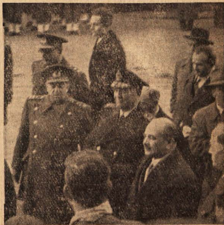
Slovesen in prijateljski sprejem predsednika Tita v Carigradu

Na konferenci so govorili tudi o vprašanjih investicijske graditve. V tej zvezi je tov. Vukmanović zlasti poudaril, da je škodljivo začeti graditi nove industrijske objekte. Vsa razpoložljiva sredstva je treba osredotočiti na glavne objekte, ki morajo začeti obratovati že letos. Razen ostalih perečih vprašanj so v razpravi posvetili veliko pozornost tudi družbenim planom okrajev.