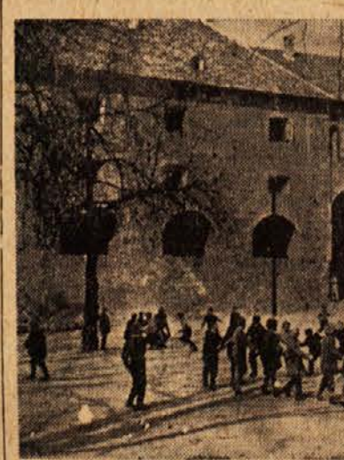
Zavrteli smo se v krogu

nepovabljenim ne sme dovoliti se v gosti! Kosmatina sram ni krasti, kar po hosti prilomasti; volk, ovej, je pošteruh, vse pospravil bi do muh; zvitorepka, ko bi tekla, z repom z miz bi vse pometla, s sabo te dobrote vzela, sama pila, sama jela, ptičkom dober tek želela.