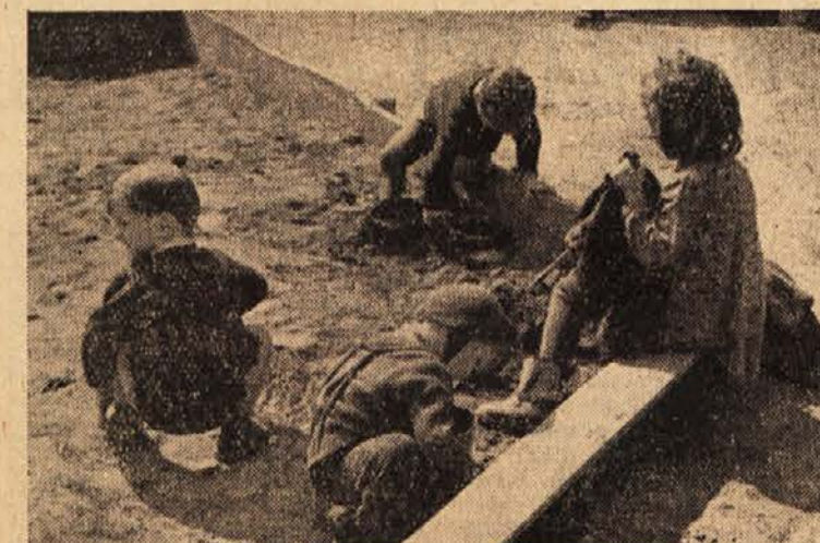
Tu se najdemo vsak dan

No, še vedno je spanec bežal od nje. Pokazalo se je, da je vzglavje pokazalo pretrdo. Zvito-