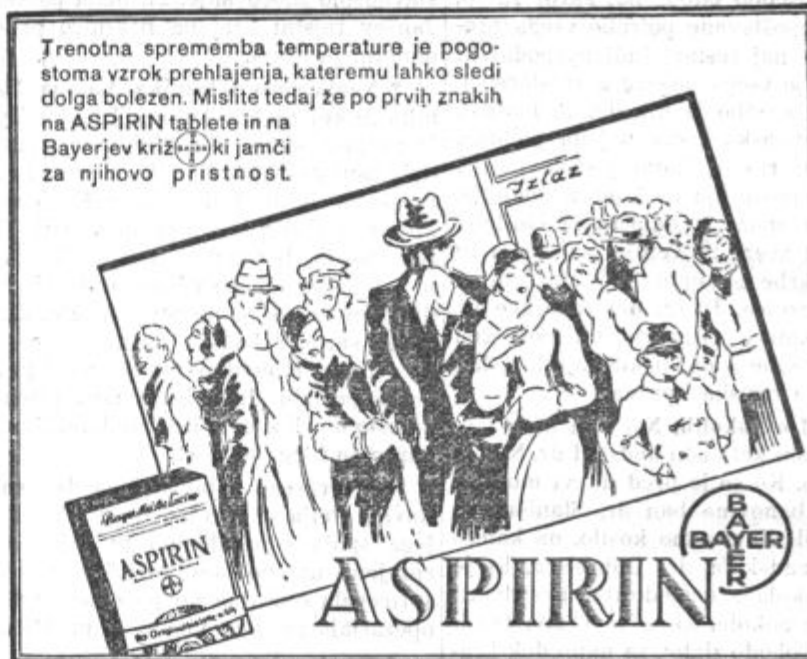
V. z. «JUGEFA» k. 4. Zagreb, Gajeva 32. Oglas je registr. pod S. br. 437 od 10. I. 1934.

— Zadruga niso oproščene takse na račune, pač pa kmetje sami. Ker se je pojavilo vprašanje, ali so tudi kmetje dolžni izdajati račune s predpisano takso v smislu tarifne številke 36, taksne tarife, je davčni oddelek finančnega ministrstva izdal tole pojasnilo: Kadar prodajajo kmetje lastne pridelke neposredno kupcem, niso obvezani izdajati računov in tudi ne plačati taks. To pa se ne nanaša na takšne primere, kadar prodajajo te pridelke kmetijske zadruga, pa tudi ne na primere, kadar nabavljalne in konsumne zadruga prodajajo blago svojim članom, ker je na podlagi določb tarifne številke 36, ki so stopile v veljavo 21. aprila, v teh primerih tudi za zadruga ter za nabavljalne in konsumne zadruga obvezno izdajanje računov in plačilo taks.