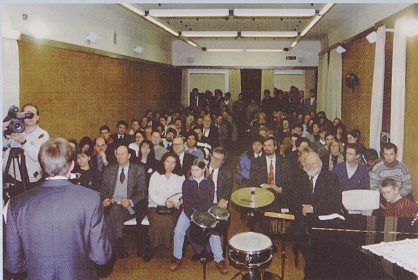
Udeleženci VII. Slovenija party v nabito polni Peterlinovi dvorani.

Za tako pomembno akcijo smo mladi združili moči, saj je bilo treba veliko priprav: treba je bilo pripraviti dvorano (tu se moramo zahvaliti odboru Marijinega doma pri Sv. Ivanu, ki je dokazal veliko občutljivosti in posluha za potrebe mladih), poskrbeti za pijačo in glasbo: treba je bilo pobudo reklamirati, izdelati plakate in letake ter jih razmnožiti... Dosti dela je bilo tudi z iskanjem daril za dobro-