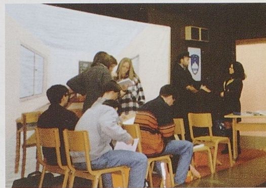
Tajno društvo PGC v Postojni.