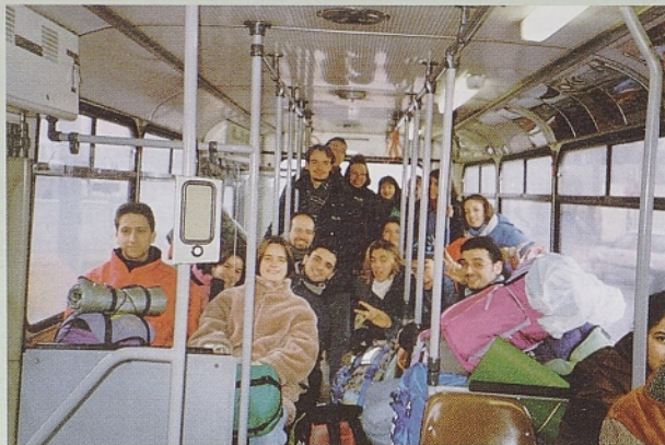
Skupina udeležencev iz Trsta z novimi prijatelji iz Ravenne in Vicenze.

V drugi župniji so imeli drugačno izkušnjo. Na Silvestrovo so si morali sami preskrbeti skromno zakusko in s