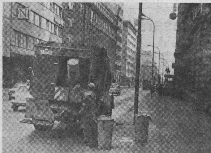
CISTOČA — »Komunalci« se morajo navsezgodaj potruditi, da počistijo mestne ulice in s tem ovirali promet. Vsak dan mesto olajšajo za več sto ton smeti in druge nesnage, ki se nabere v smetnjakih.