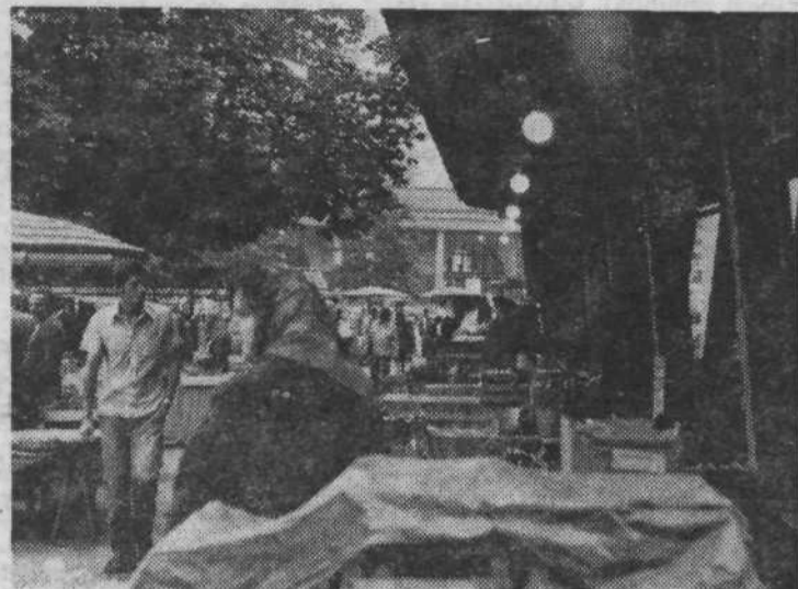
TRŽNICA — Ze v zgodnjih jutranjih urah ljubljanski trg zaživi. Prodajalci iz vse Slovenije in skoraj iz vseh naših republik začno pripravljati stojnice in razporejati svoje pridelke, saj bodo kupci kmalu tu.