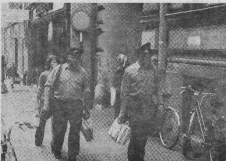
POSTA — Zjutraj so poštni torbe najtežje, še posebno takrat ko se raznašajo časopisi. »Hitro pot pod noge in od stanovanja do stanovanja«, saj vsi željno pričakujejo poštarja.