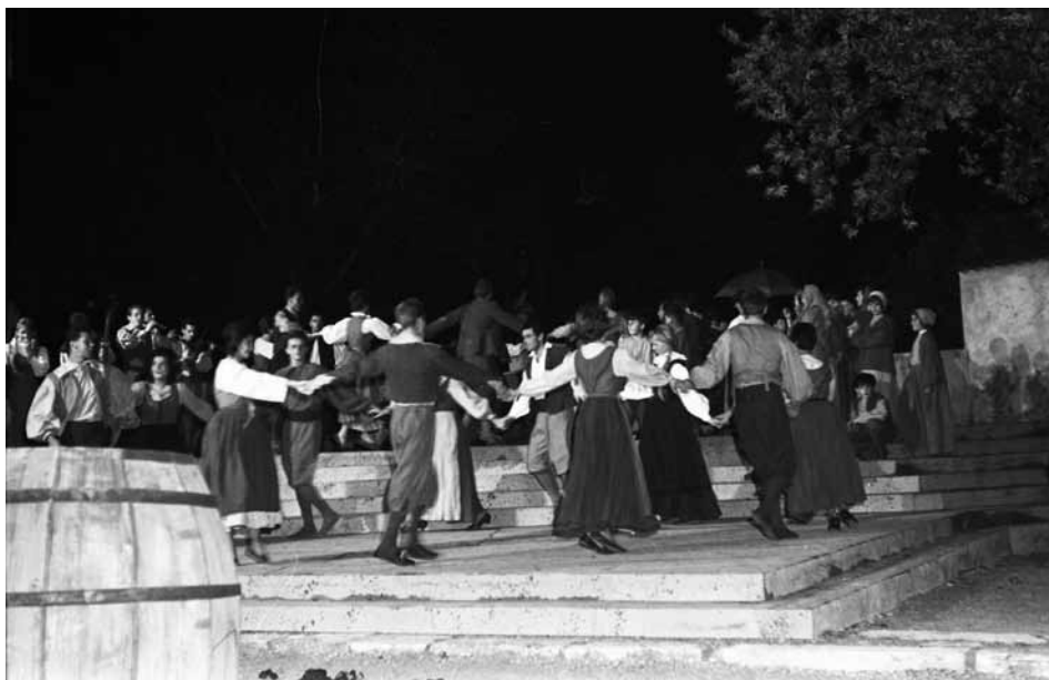
Prizor iz Visoške kronike (1963).