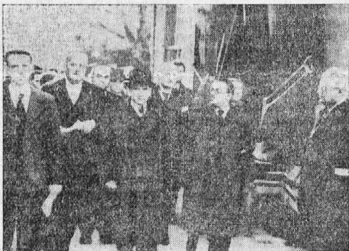
Po njem se bo imenovala nova francoska obrambna črta ob francosko-nemški meji.