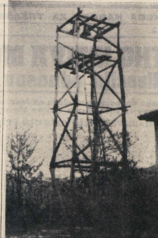
Slovenske vasi vzdolj državne meje proti videmski pokrajini so med najbolj zanemarjenimi na gorškem. V vasi Jazbine so na primer mladiči v zimskih mesecih sami za sbo popravili ceste, da so jih lahko uporabljali. Kljub njihovemu prizadevanju pa imajo oblasti za zahitve vaščanov gluh ušesa. Samo in cerkev je v skednju. Pokopališča pa sploh nimajo. Na sliki jazbinski zvonik pod vlado kršćanske demokracije.

GORICA, 6. — Zveza trgovcev za gorško pokrajino sprva vsi eni njenemu sedcu v