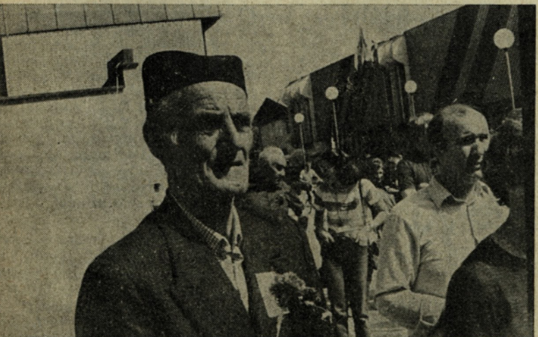
Eden od najstarejših potnikov letošnjega vlaka