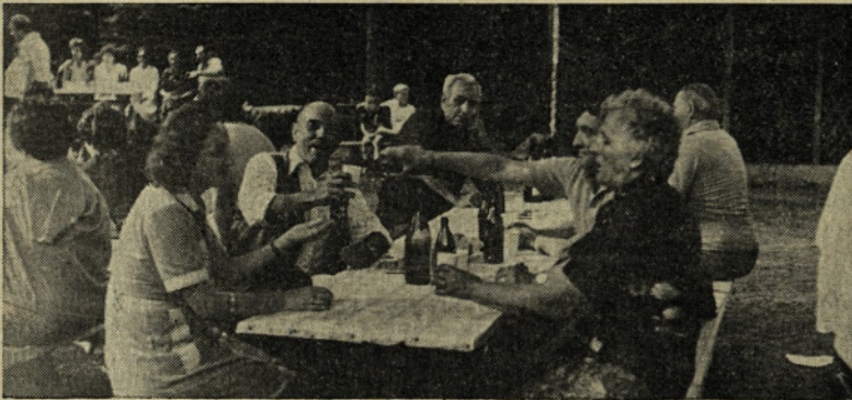
Veselo med prijatelji