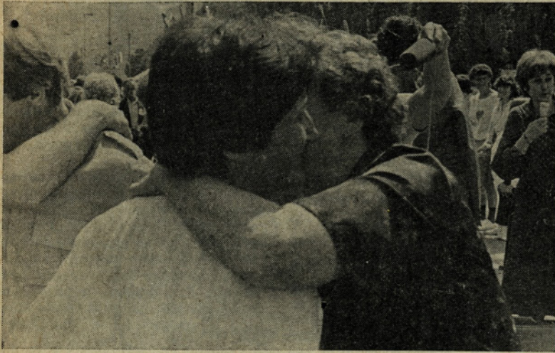
Prisrčni objem prijateljev