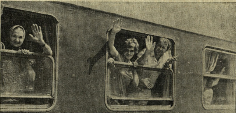
Nasvidenje in hvala

razumevanja. Tako je došlo i do ustvarjenja i ove veze putem voza, koji se uzajamno posećuju oni, koji su se zbratimili. Tako je došlo i do bratimljenja moje škole — Osnovne škole »Petar Leković« iz Požege i škole »Bratov Polančičev« iz Maribora. Koliko je simbolike u činu bratimljenja škola koje nose tako slavna imena, kao škole sa imenom prvog narodnog heroja Jugoslavije, i škole sa imenom slavni slovenačkih partizana — junaka i heroja. Još je puno, mnogo primera za ogledanje našeg bratstva.