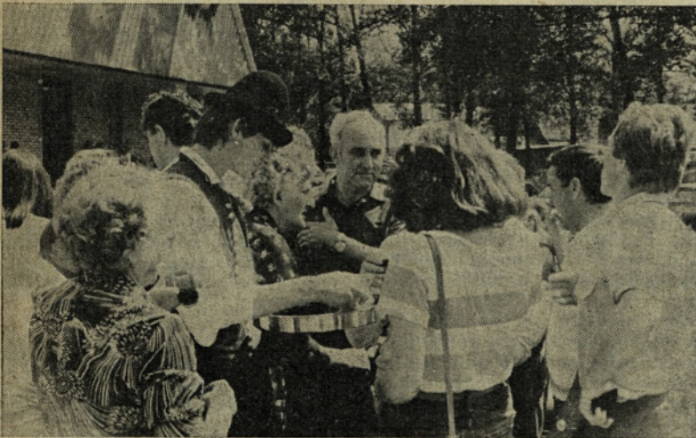
Dobrodošlica pred SO Šentjur