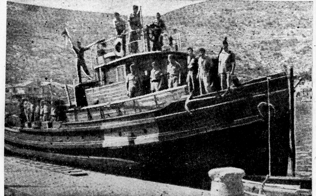
Ema izmed naših slavnih oboroženih ladij v narodnoosvobodilni vojni na Jadranu