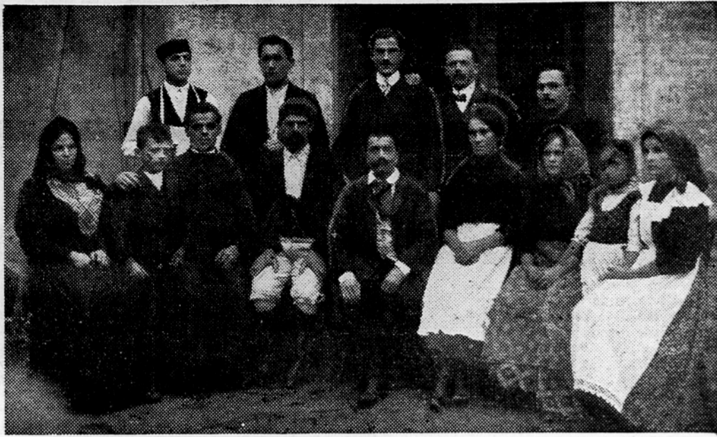
»Minar in njegova hči« na hrastniškem delavskem odru leta 1913