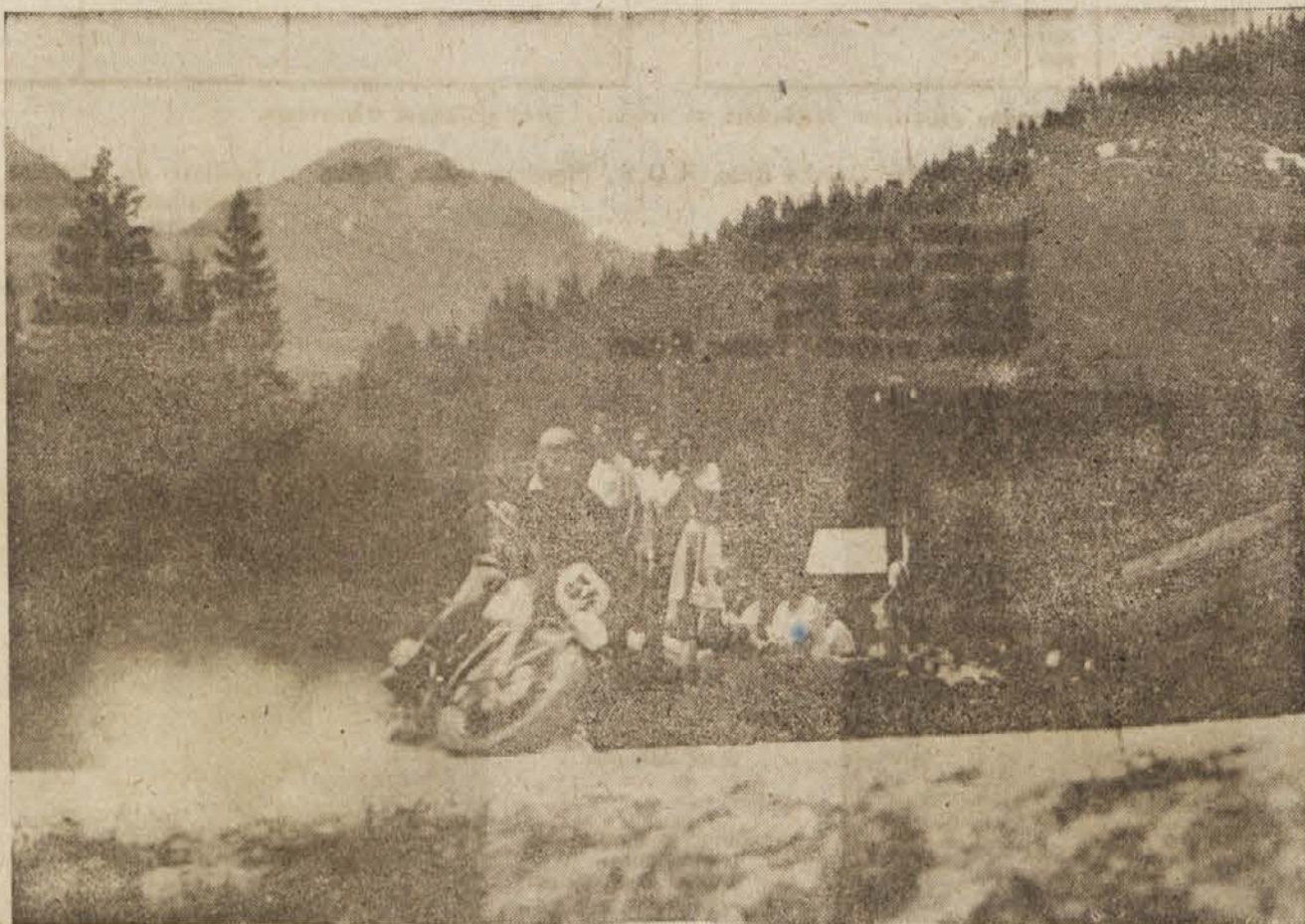
s težkim strojem na ovinku gorske proge

Naknadno prijavljene vozače bomo razglasili po zvočniku pred pričetkom tekmovanja, tako da jih gledalec lahko vpiše v proste vrste programa. V vrsto: MESTO — ČAS bodo gledalci vpisali imena zmagovalcev; tovariše novinarje opozarjamo na to rubriko, kajti z izrezom programa po končani tekmi lahko takoj dostavijo rezultate gorskega pr-