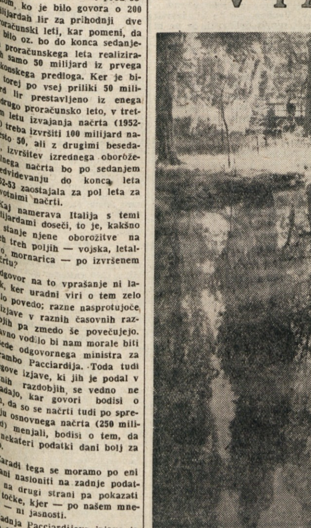
Voda, drevesa, sonce in senca

Za pokopališčem se je sprevod s kvadratsko glavo ustavil. Zarki, ki so se odbijali ob pokopališčnem zidu, so razgrevali rušo, da je opojno smelala pod nogami. Izza zidovja so se rezko bleščali kameniti spomeniki. S soncem prenapolnjene oči obsojencev so se začele utrinjati naokrog. Ko so jim zaustavili korake, so se obsojenci združili, kakor bi se prebudili iz sanj; od ječe pa do morišča je bila v resnici zelo kratka pot, toda njim se je zdelo, kakor bi šli skozi dolgo, neskončno dolgo, svetlo in s soncem prepolno pokrajino, ki ji ni bilo koma. Bila je ena sama nepregledna, svetla dežela, v kateri ni bilo ne gora ne pobočij in nobenih drugih temnih ovij. V tej neskončnosti je sleherni občutil in še enkrat preživel vse svoje življenje, od prvih otroških spominov pa do trenutka, ko je iz temne in hladne večje stopil na svetlo cesto med štiri stene hladnih, a nemirnih oč; eksekucijske čete. Kakšna je ta pot...? Prava meja med življenjem in med smrtjo je tako blizu, da se je skoraj z ramami dotikala, a vendar se ti zdi vse, kar te obdaja, tako širno, tako prozorno, da bi te kar dvignilo s tal, da bi se spojil s to prozornostjo in izgubil, ne da bi se zavedel trenutka, ki človeka loči od smrti.