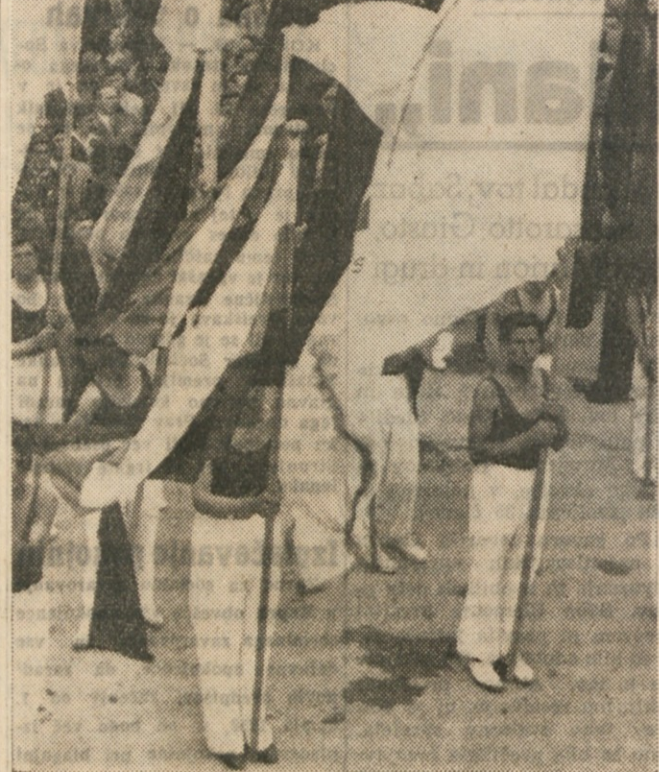
GESLO VSEH NAS MORA BITI: VSE SILE ZA 1. MAJI