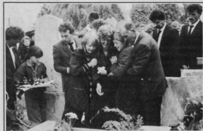
Obupa na pogrebu moža oz. očeta ...