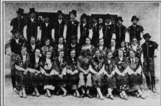
Prva folklorna skupina iz Markovcev ob nastopu v Vidmu pri Ptujju 16. junija 1939.