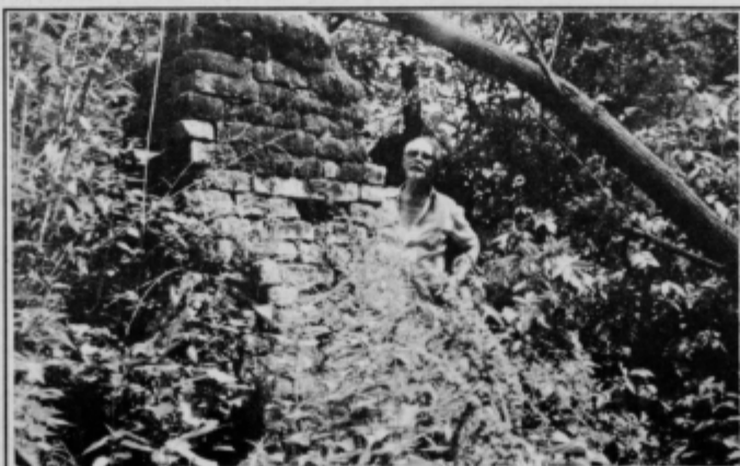
Ruševine mlina v Godenincih jlinja 1993.