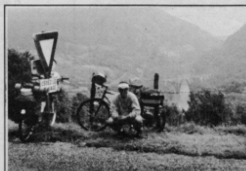
Zlatko Merc — počitek pred Ženevo