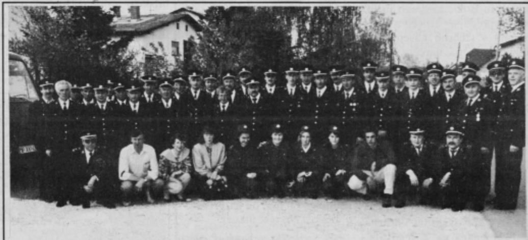
Novi nižji gasilski častniki s predavatelji in predstavniki ZGD občine Ptuj.

Orfejevega življenja in c) ker je v bližini kavabara Orfej. Nagrada za pravilen odgovor: muzejske publikacije, družinska vstopnica za ogled muzejskih zbirk in pijača za dve osebi v kavabaru Orfej. Odgovore pričakujemo v uredništvu Tednika, Raičeva ulica 6, do sobote, 7. avgusta.