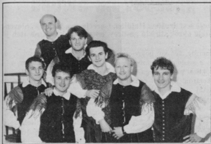
Nagrada občinstva na 2. festivalu Vurberk '92, nagrada občinstva na 23. festivalu Števerjan '93 in nova kaseto. Kaj bo na ptujskem festivalu po uspešni avdiciji?

Mimogrede: pozanimal sem se glede dviga stanarin pri Stanovanjski skupnosti občine Ptuj, ki je za julij zvišala stanarine samo za 4 odstotke kot zadnje tri mesece. Predvidevajo pa, da naj bi se njihova stanovanja oziroma stanovanja v družbeni lasti ovrednotila vsega za 52 odstotkov, kar mora pred uveljavitvijo potrditi ptujski parlament. Franjo Hovnik