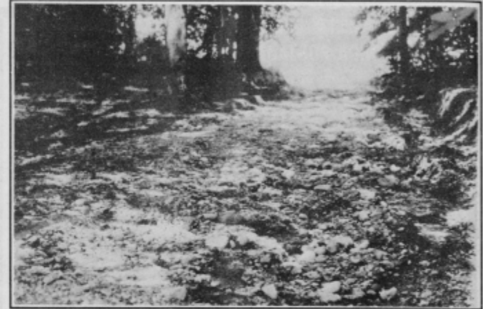
Pred kratkim so na novo gramozirali in uredili cesto v Ihovi. Neurje je cesto tako uničilo, da po njej ne morejo z avtomobilom v dolino. Ana.