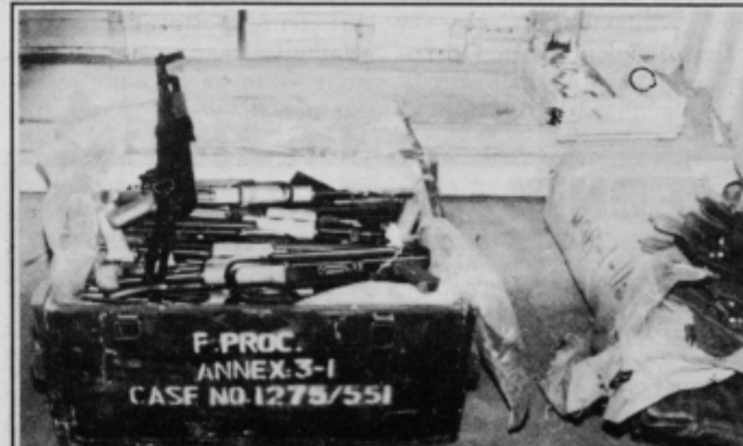
V 11 zabojskih je bilo 10.900 takihle avtomatskih pušk, 40 minometalcev, 1.000 min in 757.000 nabojev za puške

O izvoru orožja govorijo vse mo-goče. Je morda pot do resnice tudi na nalepki na enem od zabojskov z orožjem?