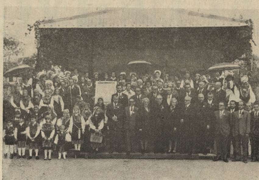
Zastopniki organizacij in domov ter predstavniki slovenske organizirane skupnosti v Argentini, obdani od narodnih noš, na 19. slovenskem dnevu v nedeljo 21. aprila v Slomškovem domu v Ramos Mejija.

„Ta dan ni samo naša največja narodna manifestacija, ampak tudi manifestacija Slovenske ideološke emigracije. Emigracije, ki hoče ostati zvesta svojim načelom; tistim načelom, ki so jih tisoči slovenskih mož in fantov potrdili za lastno krvjo. Zato tudi danes slovesno poudarjamo, da smo mi, zdomski Slovenci, protikomunistična emigracija. Bili smo odkupljeni za ceno tisočevih in zato je naša dolžnost, da to brez strahu, brez vsake opreznosti, a v vsakem trenutku tudi izpričamo. Le tista emigracija uspe pri svojem