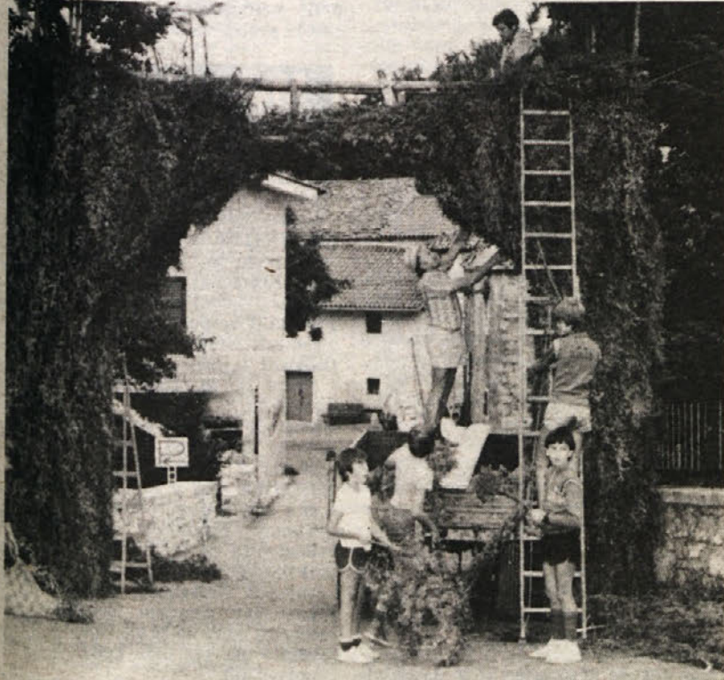
Stavolok na Colu, ki naznanja 11. Kraško ohcet

Za morebitna druga darila lahko telefonirate na Primorski dnevnik, tel. 79-46-72.