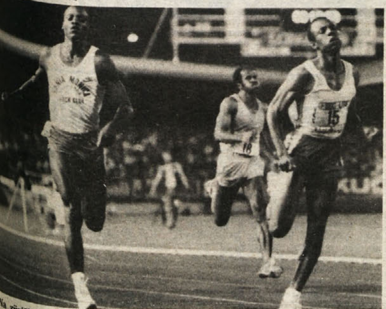
Na ziriškem atletskem mitingu so dosegli vrsto izjemno dobrih izidov. V srečanju pozornosti pa je bil dvoboj na 200 m, v katerem je Calvin Smith premagal svetovnega prvaka Lewisa.