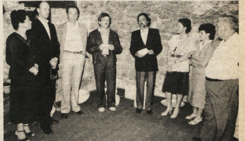
Umetniki, ki razstavljajo v repenski Kraški hiši