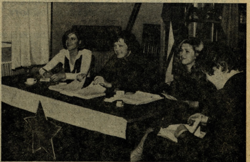
Ta brhka dekleta so pri zadnjem referendumu na volišču odlično opravila svojo odgovorno nalogo. Prepričani smo, da bodo one ali njihove sodelavke z enako vnemo delale na volišču 31. marca 1978.