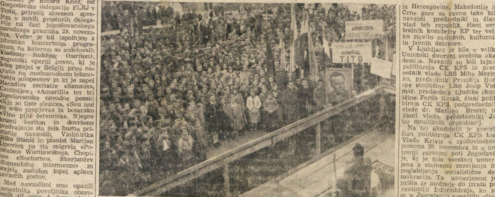
NAD SESTITISOGLAVA MNOZIČA NA VELIČASTNI PROSLAVI 29. NOVEMBRA VECERAJ V BUJAH

Svečan sprejem na Gospodarski delegaciji FLRJ v Trstu in na sedežu VUJA v Kopru