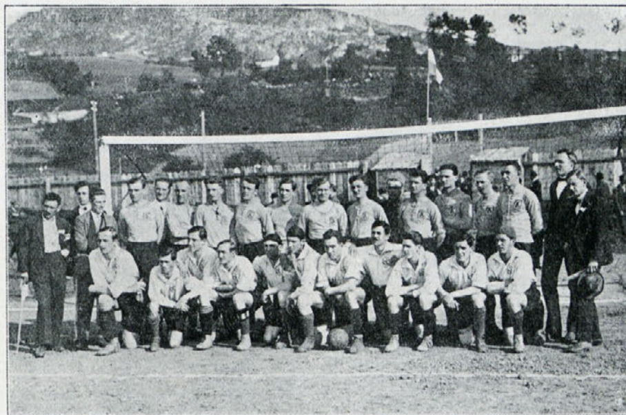
Moštvo Gradjanskega SK. in Sarajevskega amat. sp. kluba 16. maja v Sarajevu.

10. Tekme se bodo vršile po pravilih Lahkoatletičnega saveza za Hrvaško in Slavonijo. Po istih določbah se tudi rešujejo vsa sporna vprašanja.