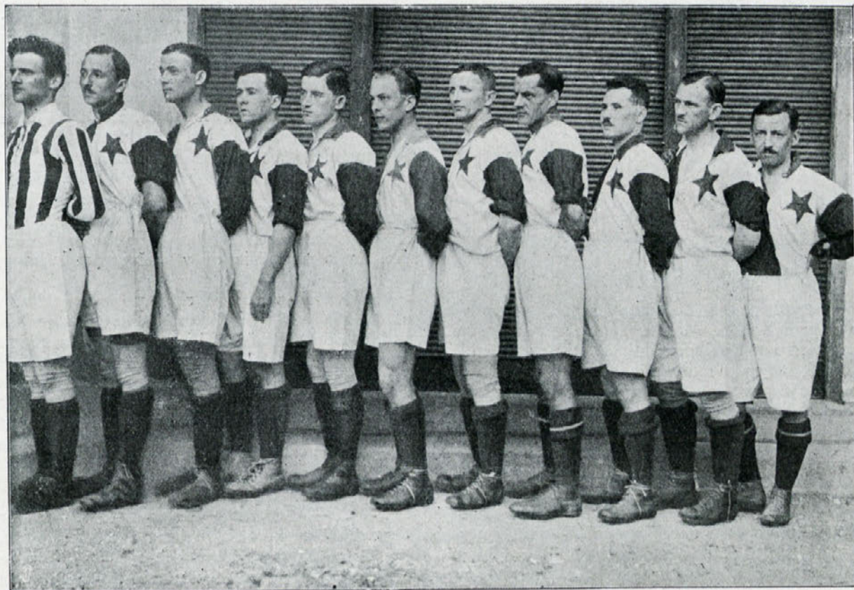
Praška Slavia v Ljubljani: Moštvo, ki je igralo 21. t. m. proti Iliriji.

Poset Slavije je bil torej za nas poset dragega prijatelja, to še tem bolj, ker smo pozdravili v njej zastopnike bratskega nam naroda češkega.