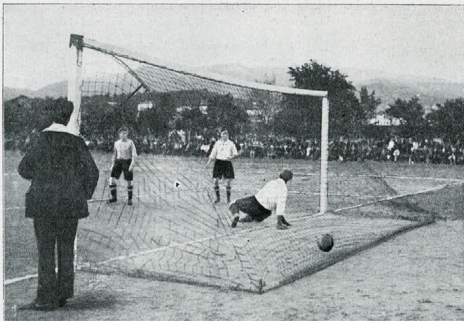
Gradjanski – Saraj, A. Š. K. Edini gol za Sašk.

metanje krogle, diska in kopja, vse z obema rokama, skok v višino in daljavo z zaletom in brez zaleta skok s palico, troskok menjaje nogo (leva—leva—desna ali obratno).